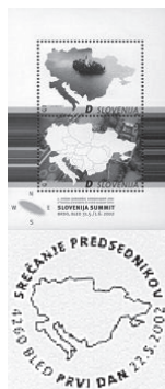
Ilustracija 4: Priložnostna znamka in po- štni žig ob deve- tem srečanju srednjeevropskih predsednikov na Bledu l. 2002