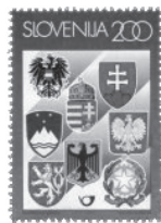
Ilustracija 3: Priložnostna znamka ob četrtm srečanju srednjeevropskih predsednikov v Piranu l. 1997