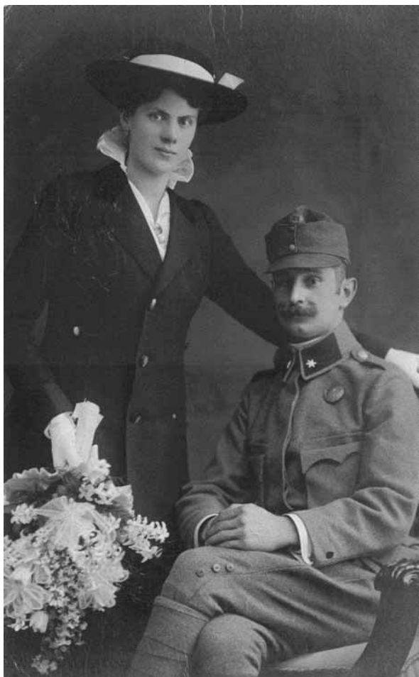
Mladoporočenca (Vir: zasebna zbirka Walterja Lukana).

in nagovori. V nekaj pariških okrajnih uradih so samo dopoldan izvedli po tristo porok.« 5