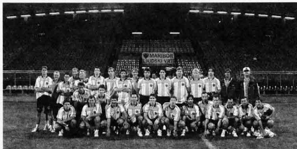
Ekipe Zedinjene Slovenije na obisku v Mariboru