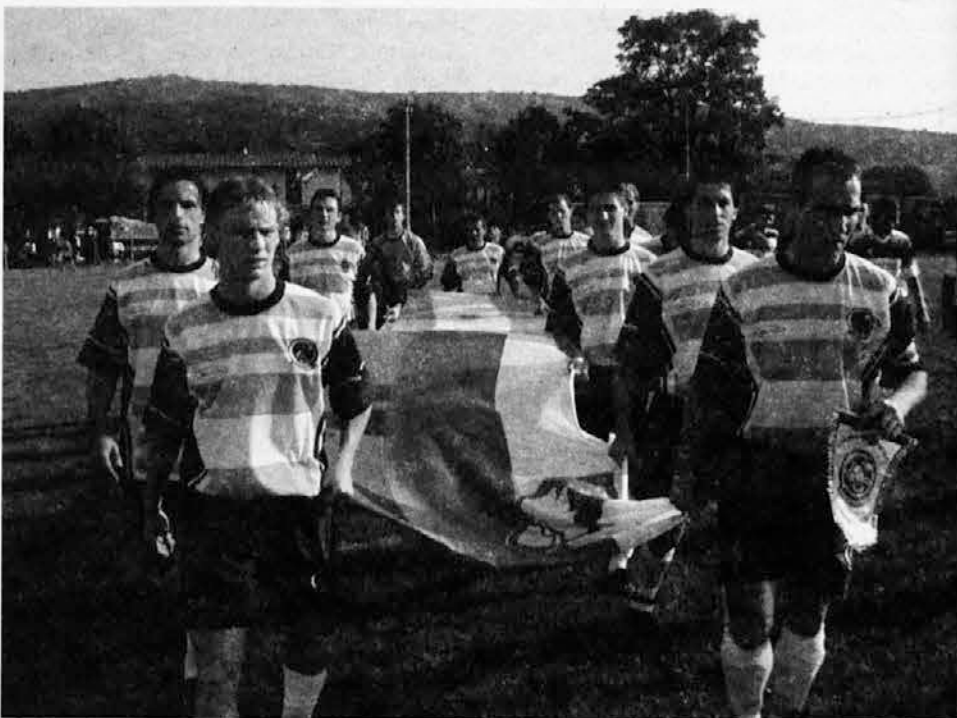
Ekipa ob prihodu na igrišče s slovensko in argentinsko zastavo