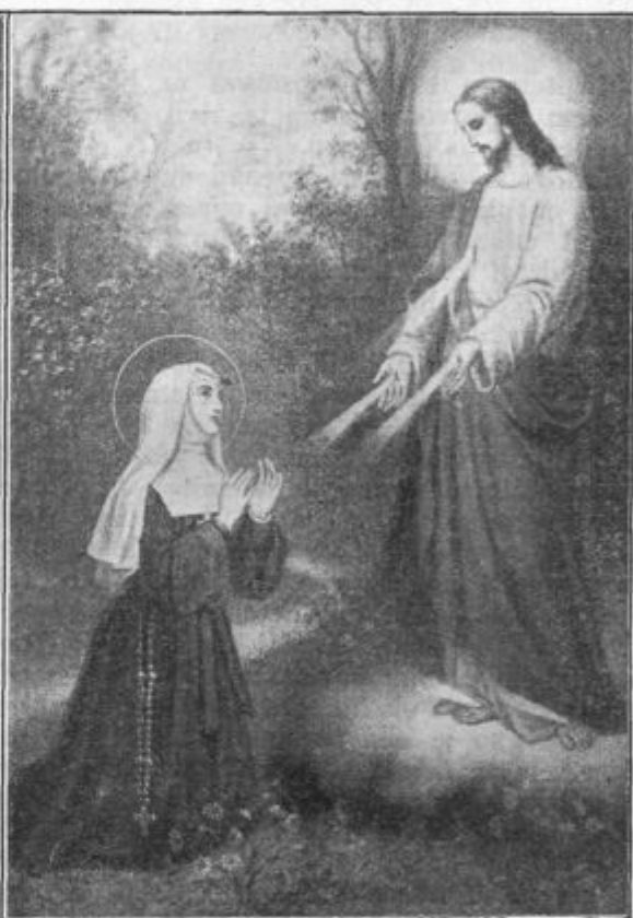
Jezus razodene svoje Srce sv. Margariti.

večje križe srečavamo.« — »Naše zasluge in napredek v dobrem ne obstoje v mnogih tolažbah in sladkostih, temveč v potrpežljivem prenašanju velikih stisk in težkih bremen.«