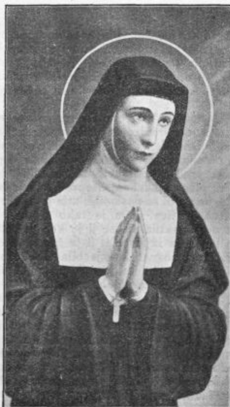
Sv. Margarita Marija Alakok. Praznovanje 25. okt.

ve. S kakšnim poudarkom je brala: »Ljubezen, ljubezen! Darujmo se ljubezni. Ta edina bo mogla ogreti naš oledeneli čas. Prenovljenje, ki mora priti, mora priti po ljubezni.« — »Ljubezen je plamen, ki hoče požgati žrtev. O, da bi bili takšna žrtev! Da bi tudi nas požgal ta sveti plamen! Brezmejna ljubezen nas vabi. Sledimo ji z brezmejnimi zaupanjem!« — »Tudi jaz bi z apostolom hotela videti in vedeti le eno: križanega Jezusa! Na veke bi se hotela