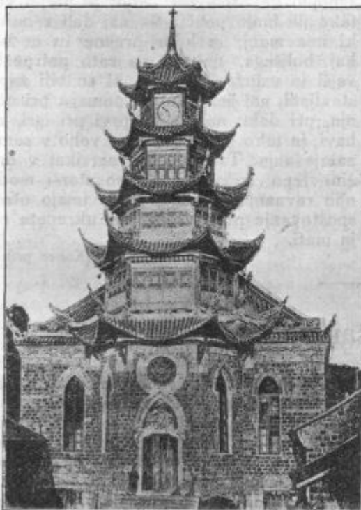
Katoliška škofijska cerkev v Konyang-u na Kitajskem.

kar v sovraštvo. Pregovor pravi, da nevoščljivec ne more videti, ce soince sije v vodo. Gorje staršem, če pride z otroki tako daleč! Večen nemir in jezo imajo v hiši. Še dobri ne smejo biti tistim, ki so res vredni pohvale. Zavist hoče kot požar obvladati vse. Kjer se zavist razšopiri, ne raste nobena čednost več v miru. V takem slučaju, če starši opazijo, da se otroci tožarijo in preganjajo iz zavisti, je najboljše ravnati tako, da puste zatoženca brez očite kazni, tožitelja pa pogosteje odločno spomnijo na njegove napake.