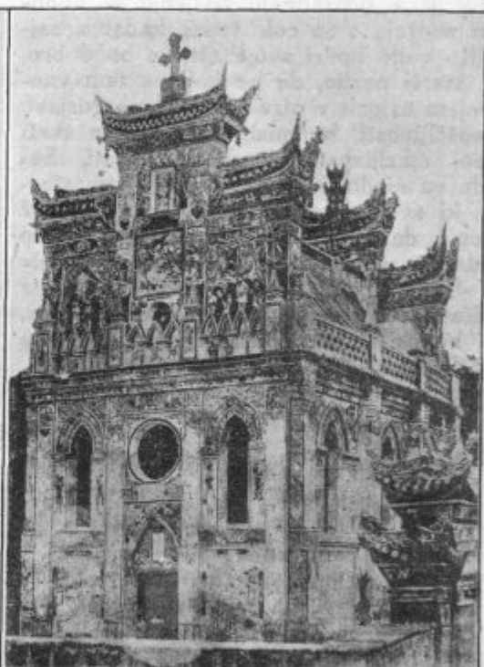
Cerkev Notre-Dame v Konythéon. (Kitajsko.)

v tem, da se škodoželjno krohotajo, če kateri česa ne doseže, po čemer je hrepenel; če se mu kaj ponesreči, s čemer se je ponašal. Pokaraj tako trdosrčnost zelo užaljeno! Paziti pa je treba na otroke tedaj, kadar imajo med seboj kako barantijo, primerjajo in preminjajo svoje blago: ob takih prilikah se nekaterim čita na licih prav grda zavist. Posebno očita je pa nevoščljivost ondi, kjer se otroci med seboj zahrbtno tožarijo, drug proti drugemu spletkarijo, se drug v drugega zadirajo, drug drugemu najljubše reči skrivši končavajo — tu je pa zavidnost že prešla