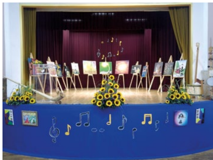
Razstava na Kopitarjevih dneh