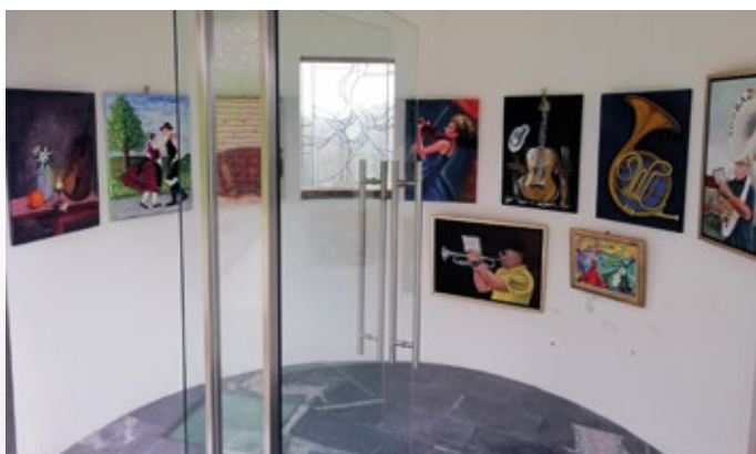
Razstava v paviljonu v Šinkovem Turnu