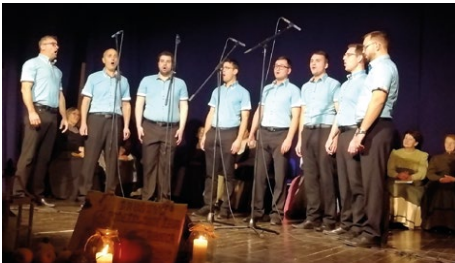
Matici na odru v Ribnici

Matici v segmentu bogoslužnega peja zvesto sledijo zapuščini repenjskega moškega zbora, ki je vsako prvo nedeljo v mesecu prepeval v samostanu pri šolskih sestrah, z največjim veseljem pa se trikrat v letu udeležijo še slovesnega bogoslužja pri sv. Tilnu; na praznik sv. Trojice, na Tilno nedeljo in pri polnočnici. Letos bodo znova sodelovali tudi v Bukovici pri blagoslovu jaslic sredi vasi, ki bo v petek, 23. decembra, ob 17. uri. V župnijski cerkvi pa zapojejo še ob ljudski pobožnosti križevega