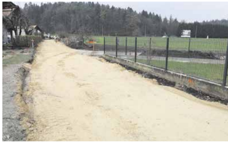
Obnovljeno kanalizacijsko, vodovodno in cestno omrežje na Krumperški cesti v Zaborštu