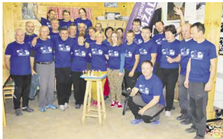
Člani PDD na Zelenici

Domžalah. Na steni garažne hiše se bo odvijal Evropski pokal v lednem plezanju, tekma pa bo hkrati tudi sklepna tekma slovensko-hrvaško-srbskega pokala v lednem plezanju. Plezalskih vragolij in akrobatskih vložkov najboljših evropskih lednih plezalcev bo tako na pretek.