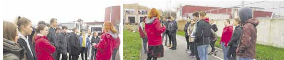
Dijaki so se seznanjali s procesi čiščenja odpadne vode na JP CČN Domžale - Kamnik.