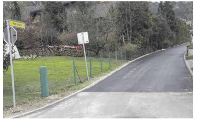
Končana obnova vodovoda in kanalizacije ter rekonstrukcija asfaltnih površin v naselju Pod hribom v Radomljah