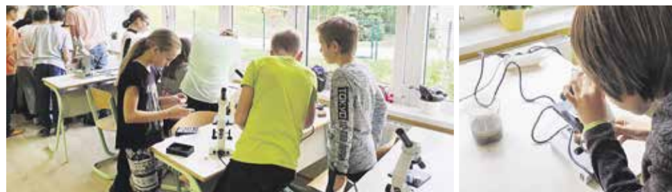
Mikroorganizmi pod mikroskopom so navdušili učence OŠ Stranje.

JAVNO PODJETJE CENTRALNA ČISTILNA NAPRAVA DOMŽALE - KAMNIK, D. O. O.