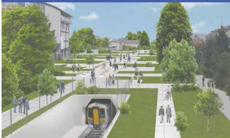
nova ŽELEZNIŠKA in AVTOBUSNA postaja