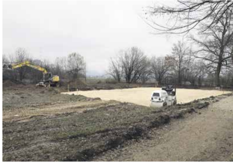
Izgradnja športnega igrišča v Depali vasi