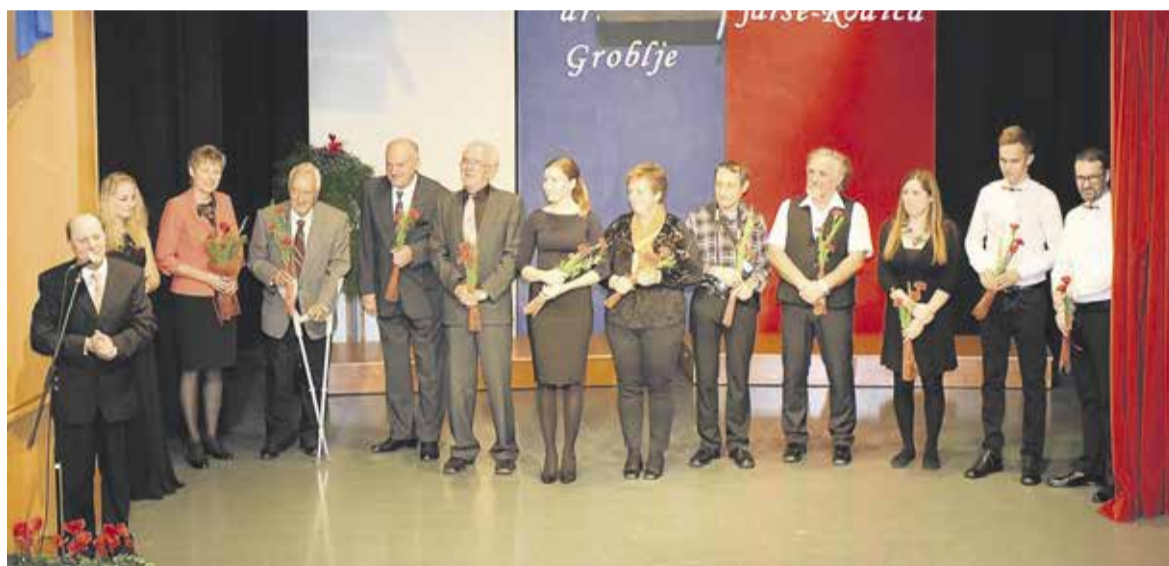
Pogled na nagrajence