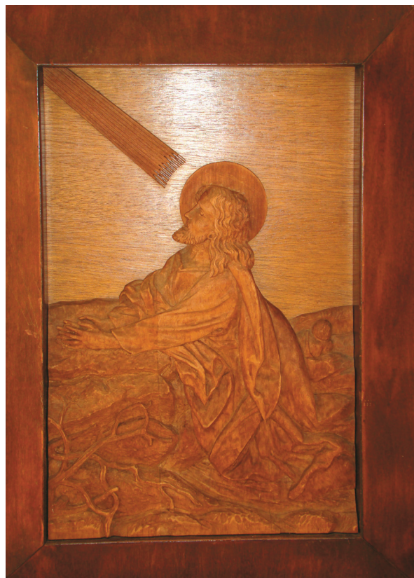
Fotografiji, posneti med izletom po Dolenjski pred nekaj leti