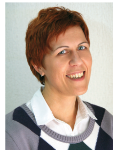
Pripravlja Irena Dolgan