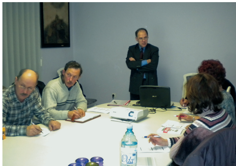
Posvet na temo: Pogoji za upokojitev - novembra 2010 v Cerknici.

Dobrodošli vsi vaši predlogi o tem, katere vsebine naj še vključimo v izobraževanje!