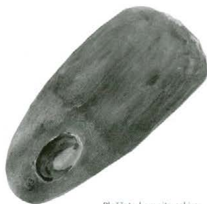
Ploščata kamnita sekira; najdišče: Trbonje

Dravograjski najdeni okamneli hrast priča, da so bile naše doline porasle