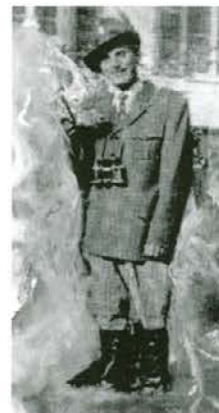
Avtor na praksi v šoli za gozdno delo v Nemčiji

V času študija v tujini sem spoznal Švico, Švedsko, Avstrijo in Nemčijo. Ponujali so mi tudi možnost zaposlitve, vendar sem to priložnost dvakrat odklonil. Najprej mi je