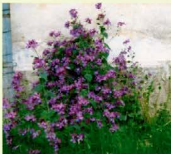
Kultivirana srebrenka v cvetu

Viri: Martinčič, Sušnik: Mala flora Slovenije.