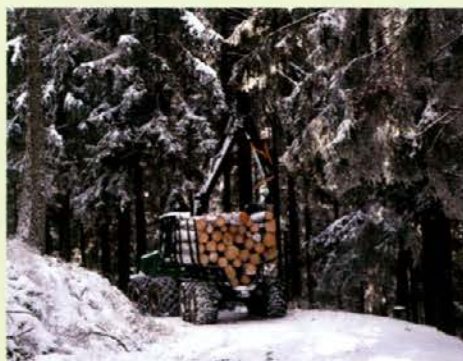
Forwader na Koparčevem vrhu

Eden od vidikov je tudi vpliv tehnologije na gozdno okolje. Zato si pogledimo prednosti in slabosti strojne sečnje nasproti sečnje z motorno žago.