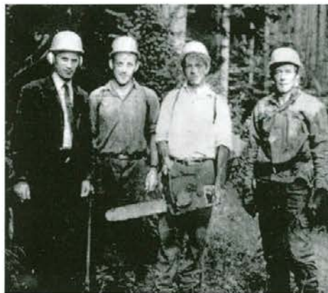
Avtor (prvi z leve) in Hafner (z motorno žago) pri uvajanju kleščanja z motorno žago v Radljah

Kot praktikant sem po končanem študiju delal na gozdni upravi Radlje. Tisti čas so bili gozdni delavci skupaj s kmeti najmanj cenjeni »delovni ljudje«. Skupaj s slovenjgraško upravo podjetja smo uspeli iz Ljubljane pridobiti dovoljenje za nabavo nekaj deset kosov norveških motornih