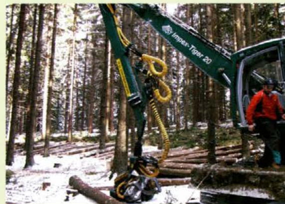
Procesorska glava harvesterja