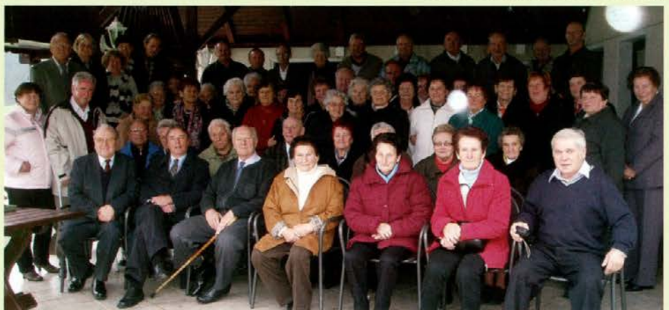
Skupinska fotografija udeležencev srečanja

V večernih urah so se upokojenci zadovoljni vrnili na svoje domove v prepričanju, da se ponovno srečajo v prihodnjem letu.