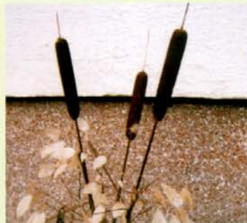
Srebrenka v družbi z rogozom