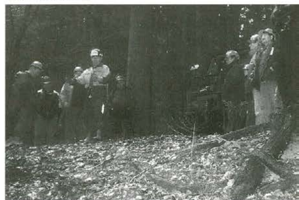
Inštruktorjeva demonstracija v gozdu