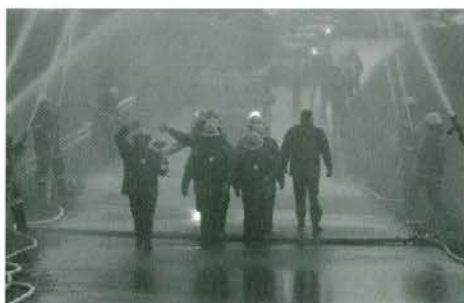
Prihod zmagovalk na Legen

tekmovanjih. V letu 2004 jim je uspelo osvojiti drugo mesto na državnem tekmovanju. Na izboru za olimpijado v letu 2006 se jim je zmaga za las izmaknila, delno je bila za to kriva poškodba ene izmed gasilk. Na tekmovanju »Zaščita in reševanje«, istega leta, so v Mariboru dosegle tretje mesto. Za dosežek so prejele priznanje Krajevne skupnosti Šmartno. V letu 2006 so v Žalcu potrdile drugo mesto na državnem nivoju, zato so od Mestne občine Slovenj Gradec prejele plaketo za prizadevno delo. Na regijskem tekmovanju so letos osvojile prvo mesto, s čimer so si zagotovile udeležbo na državnem tekmovanju za leto 2008 in postale državne prvakinje. V letu 2008 so se ponovno zbrale in obogatile zbirko pokalov z občinskega in medobčinskega tekmovanja članice skupine A.