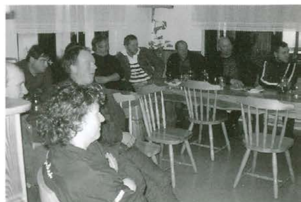
Poučne ure na domačiji Škratek

Še en pomemben podatek za lastnike, ki boste v prihodnjih letih kandidirali na javnem razpisu za nakup gozdarske opreme. Po zadnjih navodilih Agencije za kmetijske trge in razvoj podeželja je opravljeni tečaj oz. potrdilo o opravljenem tečaju eden izmed pogojev za odobritev povratnih denarnih sredstev razpisa.