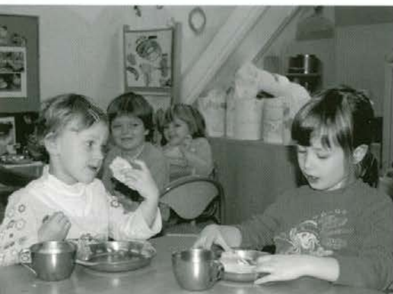
Medeni zajtrk v vrtcu S8 v Slovenj Gradcu

Okoli 55.000 malčkov, ki obiskujejo slovenske vrtce, se je v petek, 21. 11. 2008, za zajtrk sladkalo z okusnim in zdravim slovenskim medom. Čebelarstva zveza Slovenije je namreč organizirala že drugo dobrodelno izobraževalno akcijo En dan za zajtrk med slovenskih čebelarjev v naših vrtcih. Ozaveščenost o zdravem načinu življenja se začne že v otroštvu,