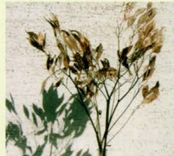
Srebrne luske gozdne srebrenke