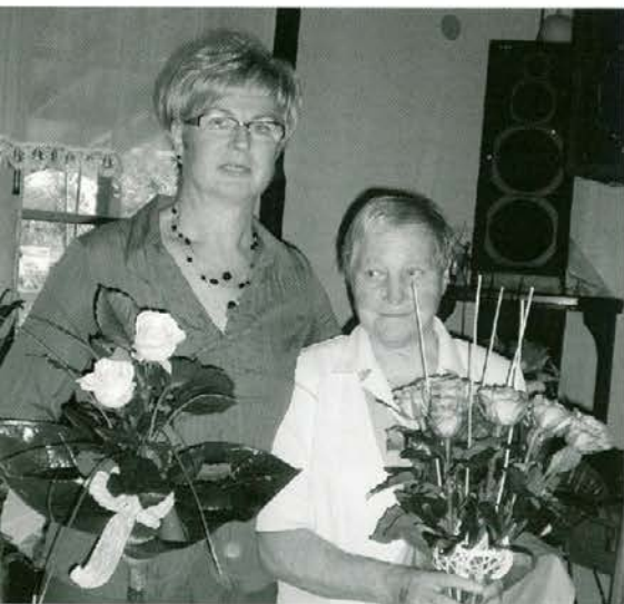
Zinka in Gelika