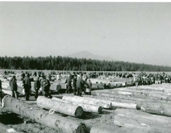
Kubični metri vrednejšega lesa na razstavnem prostoru letališča Slovenj Gradec

Licitacija bo predvidoma organizirana podobno kot prejšnji dve. Hlodovina, namenjena za licitacijo bo morala biti zložena na mestu licitacije. Kupci za posamezni sortiment oddajo pisno