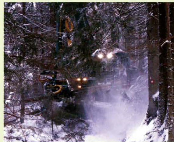
Harvester pri klešenju drevesa

Danes v Skandinaviji opravijo preko 90 % sečnje s stroji za sečnjo, v Nemčiji dobrih 50 %, v Avstriji pa nekje med 16% in 18 %. Vstop v Evropsko skupnost ter več prednosti kot slabosti novih tehnologij sečnje in spravila lesa bodo vzrok, da bodo le-te v prihodnosti vedno bolj prisotne tudi v slovenskem gozdnem prostoru. Dajmo jim priložnost.