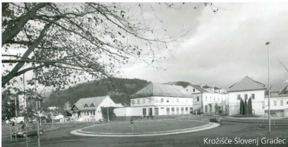
Krožišče Slovenj Gradec