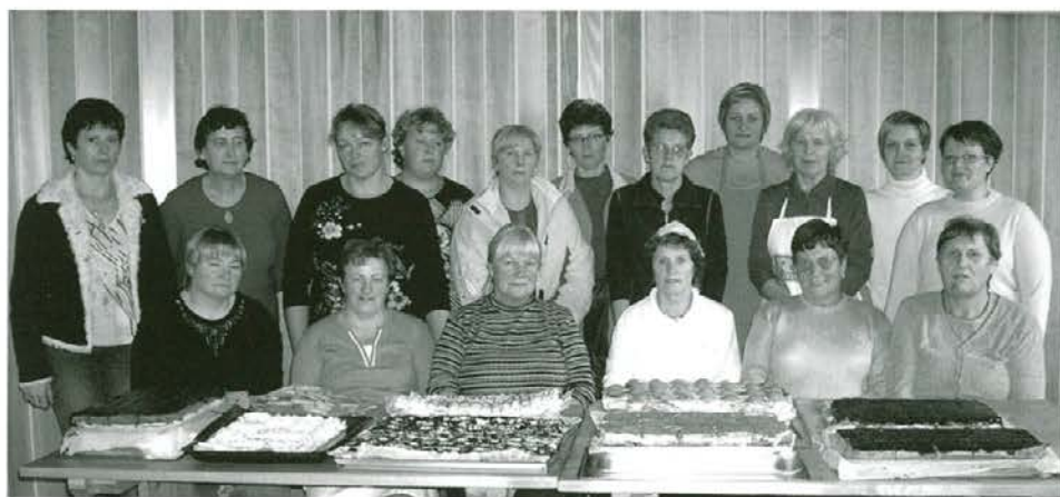
Kmečke žene iz okolice Mislinje po uspešno končanem tečaju peke rezin in rulad

Tečajnice iz okolice Sel, Vrh in Gmajne po zaključku tečaja