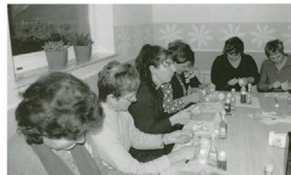
... potem pa praktični del