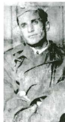
V ameriški uniformi

delo ponudil Andreas Stihl, izdelovalec motornih žag, ponudil mi je zastopništvo trženja v Jugoslaviji in Vzhodni Evropi. Drugo priložnost za delo so mi ponudili v času, ko je Jugoslavija priznala meje Vzhodne Nemčije, takrat sem bil v tovarni v Ludwigshafnu. Ameriška baza me je tu vabila za prevajalca jugoslovanskih radijskih sporočil. Moj cilj pa je bil nakup avtomobila, kar mi je tudi uspelo. Vesel sem, da sem pridobljeno znanje lahko posredoval našim gozdnim delavcem.