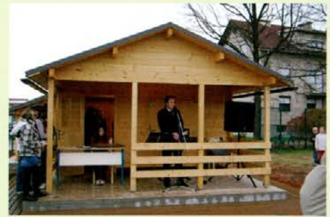
Brunarica na športnem igrišču v Šmartnem pri Slovenj Gradcu

dejavnostim Osnovne šole Šmartno, ki se ponaša z nazivom EKO šola, in dejavnostim športnega društva Šmartno. Notranjost brunarice je prijetna, les daje občutek domačnosti, zato je primerna tudi za sestankovanje in druženje. Ob otvoritvi so bili brunarice zelo veseli učenci, ki zaenkrat še ne vedo, kako jo bodo poimenovali, zagotovo pa bo kmalu dobila svoje ime. Povedali so, da so skrbni upravljalci igrišča in da zdaj imajo prostor, kamor bodo spravili orodje.