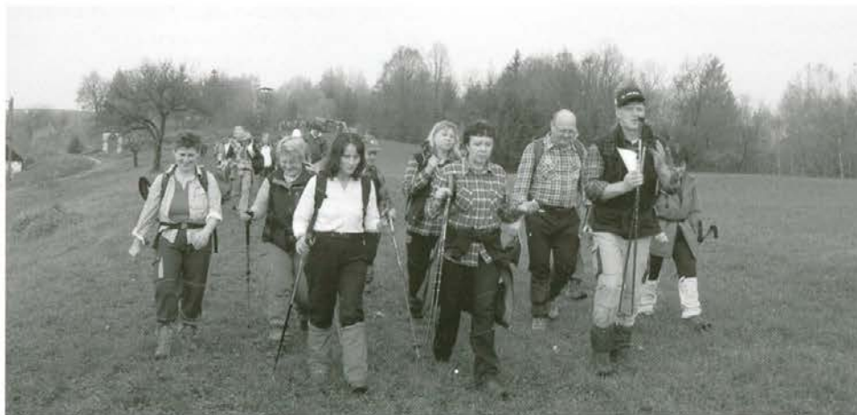
Na poti proti Čatežu smo srečevali skupine naših pohodnikov

Morsko sol si razdelite po posodah na enakomerne količine in v vsako posodico vmešajte različne barve za barvanje pirhov. Ko je sol obarvana, vam ne preostane drugega, kot da jo samo naložite po barvnih plasteh v prozorne steklenice. Na koncu dodajte še 10 kapljic eteričnega olja in steklenico zaprite. Tako imate hitro pripravljeno enostavno, vendar lepo in praktično darilo. Ko ga podarite, na pozabite povedati, da je narejeno iz srca. Učinek je zagotovljen.