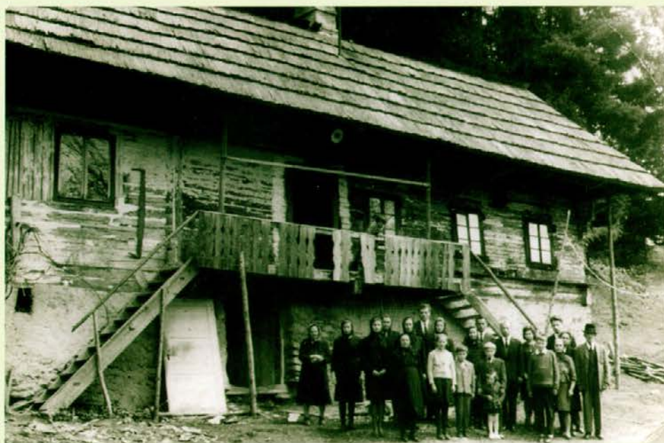
Gospodar in sorodniki pri stari hiši