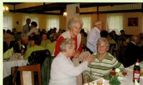
Prijetni pomenki nekdanjih sodelavcev

Tega je pripravilo vodstvo zadruga v gostišču Dular na Selah. Udeležilo se ga je preko 60 upokojencev, ki so ob prijetni glasbi in pogovoru obujali spomine na leta, ko so še bili aktivni delavci v