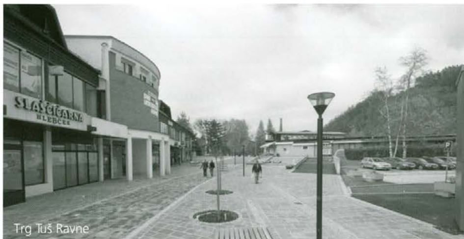
Trg Tuš Ravne

Celjska cesta 7 2380 Slovenj Gradec telefon (02) 88 39 040 faks (02) 88 39 049