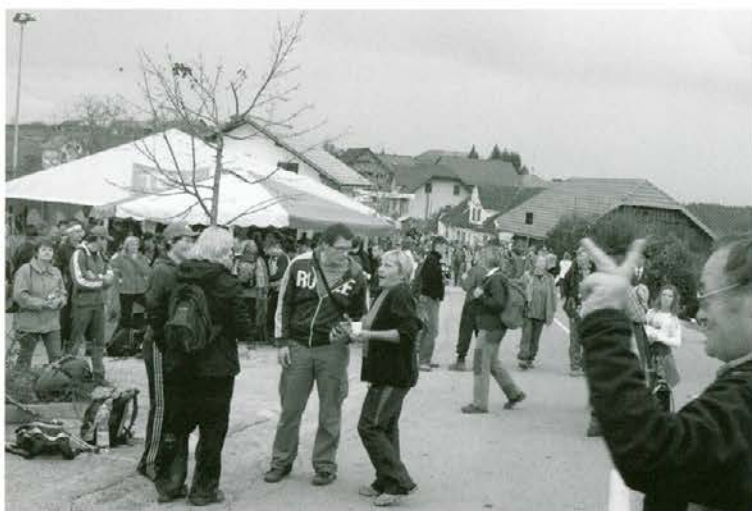
Na Čatežu pohodniki zaključijo svojo pot