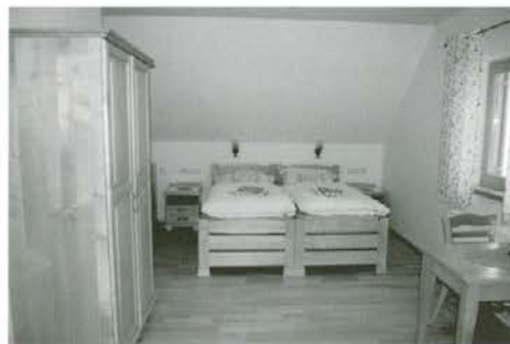
Okusno urejena soba za goste

družin iz različnih koncev Slovenije, ki se nameravajo v bližnji prihodnosti ukvarjati s turizmom na kmetiji in prihajajo k Rotovnikovim na ogled prenovljene hiše. Ljudi zlasti zanima, kako so izvedli prenovo, katere materiale so pri tem