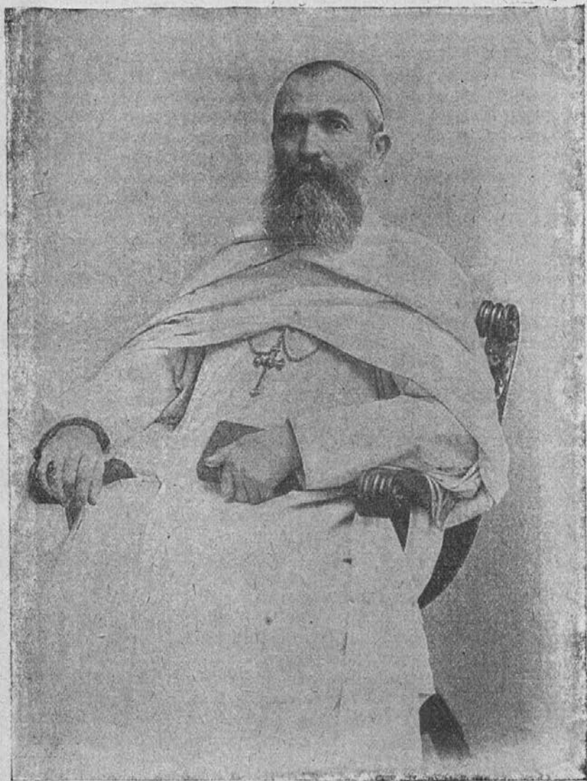
Škof Livinhac, vrhovni predstojnik misijonske družbe Belih očetov; bivši duhovni pastir mučencev iz Ugande. (Več glej besedilo str. 65.)