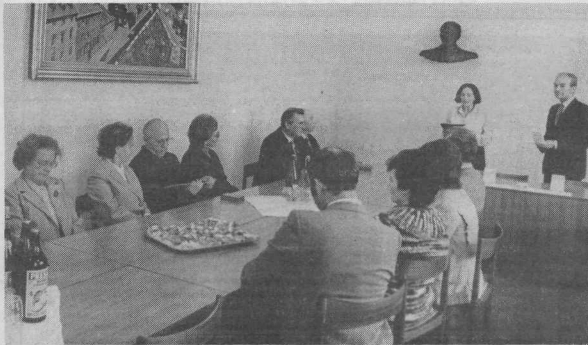
Slovesnost ob podelitvi državnih odlikovanj zaslužnim aktivistom občine Center