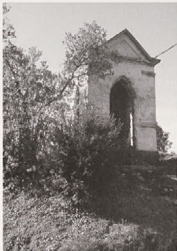
Barasova kapela v Brezovcu.