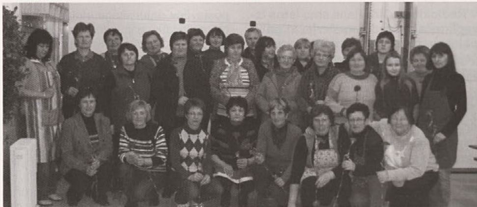
Srečanje članic 8. marca 2010