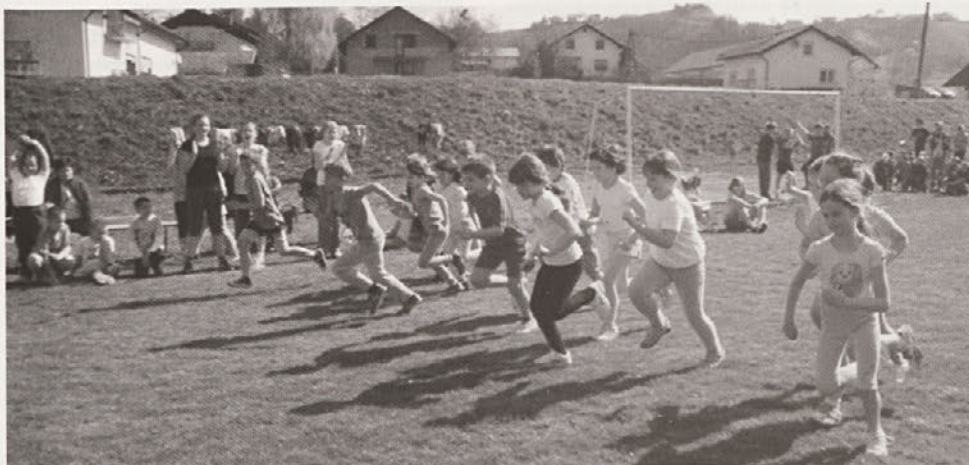
Za uspeh se je bilo potrebno potruditi.