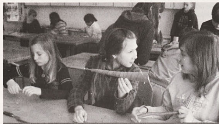
Rog iz lubja

Prda je eno najpreprostejših glasbil, ki ga je znal narediti vsak podeželski otrok, če se mu je le posrečilo sneti lubje z muževne vejice. Cevka snetega lubja se na eni strani malo »postruga«, da se stanjša, nato se stisne in dobi dvojni jeziček. Prda se uporablja samostojno ali kot sestavni del lubnatega roga.