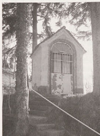
Škečova kapela v Gruškovcu. Fotografiral Ivo Zupanič marca 2008. Kapela je danes prenovljena - slika iz leta 2008 pa kaže na njen takratni izgled.

Raziskovalki sta še zapisali, da je kapela na zelo lepi lokaciji z razgledom. Okoli nje je lepo urejena okolica in tudi klopi ter mize, kjer si pohodnik lahko odpočije. Na nekaterih delih zidov se vidi, da so razpoke sanirane s finim ometom, ki čakajo še na slikopleskarska dela.