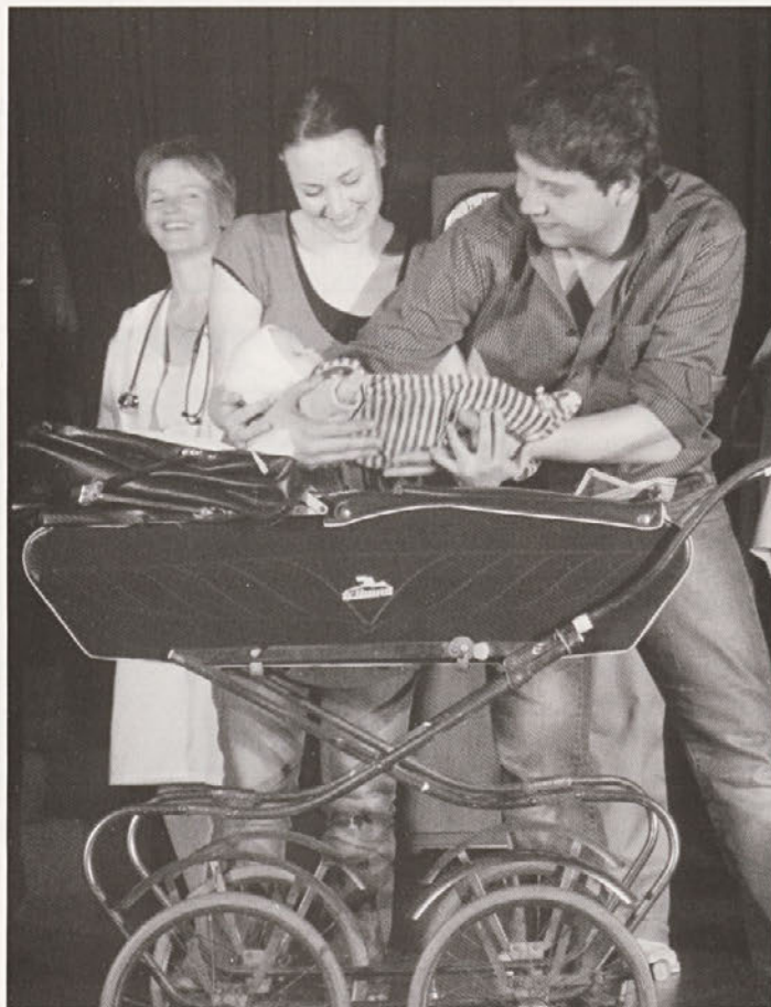
Utrinek s predstave Rodil se je očka