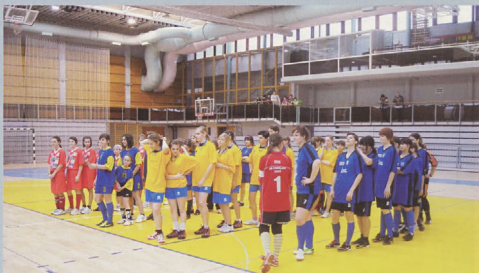
Zmaga se je ekipi OŠ Cirkulane izmuznila za las.