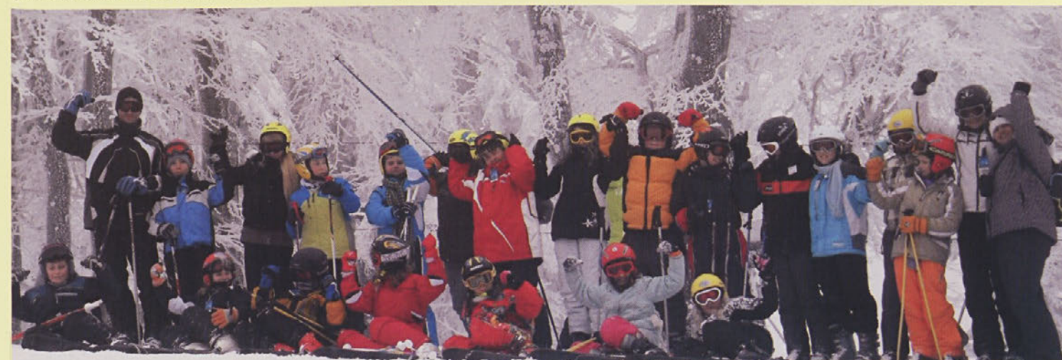
Spominska fotografija udeležencev zimske šole v naravi