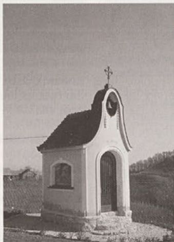
Štuhečova kapela v Gradiščah.

Kot sta izvedeli od dekana Dreva, v Paradižu stoji tudi Mrkačova kapela. Kapela je posvečena Mariji in je bila v času razisko-