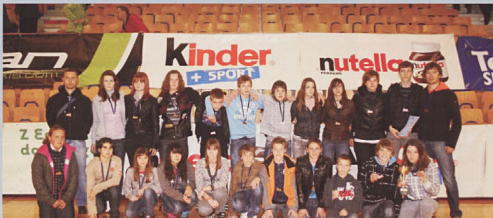
Mešana nogometna ekipa OŠ Cirkulane - Zavrč z odlično uvrstitvijo