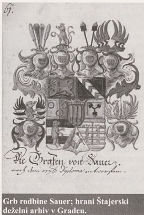
Grb rodbine Sauer; hrani Štajerski deželni arhiv v Gradcu.