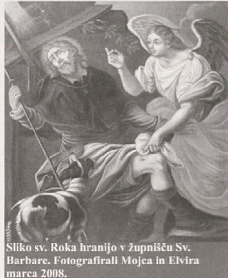
Sliko sv. Roka hranijo v župnišču Sv. Barbare.

Dekan je pojasnil, da naj bi ob restavriranju slike ugotovili, da so podoba sv. Roka izrezali iz slepega okvirja in platno pri-