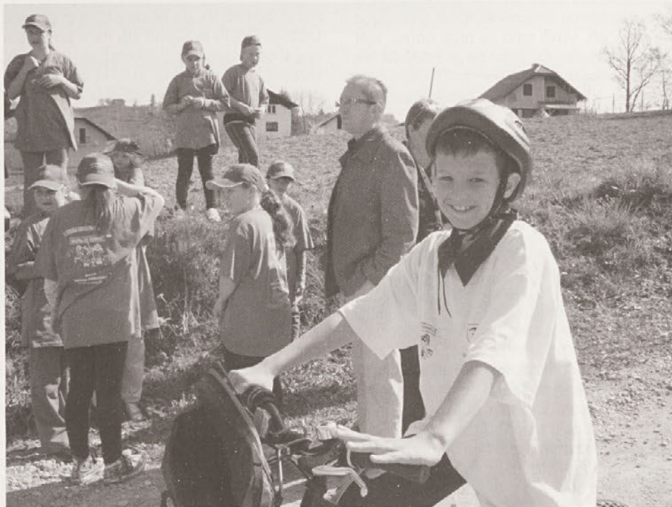
Utrinek z otroške varnostne olimpijade