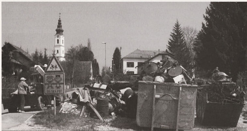
Na čistilni akciji v Cirkulanah se je pobralo za okrog 115 kubičnih metrov smeti.