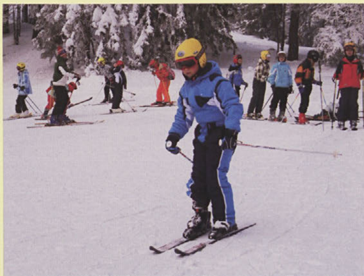
Počasi in previdno ...

Vsako jutro se je dan začel z jutranjim prebujanjem, zajtrkom ter pospravljanjem in ocenjevanjem sob. Sledile so aktivnosti na snegu. Na kosilo smo se vrnili v dom. Po kosilu in krajšem počitku nas