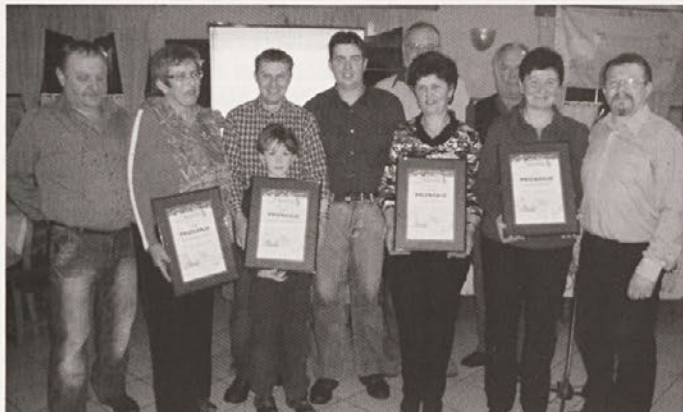
Prejemniki priznanj na občnem zboru v družbi predsednika društva

Društvo trenutno šteje 105 rejcev oziroma članov, ki prihajajo kar iz 13 občin.