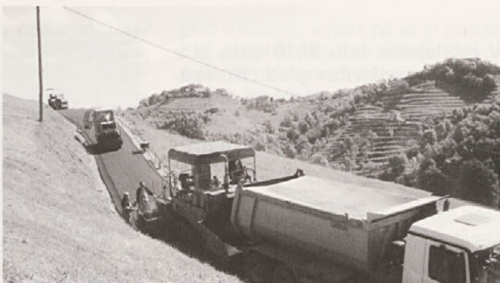
Modernizacija ceste Hratinski breg