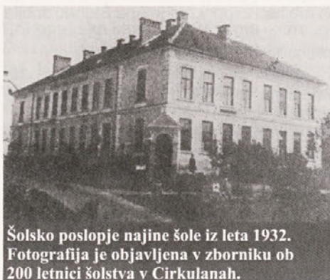
Šolsko poslopje najine šole iz leta 1932. Fotografija je objavljena v zborniku ob 200 letnici šolstva v Cirkulanah.