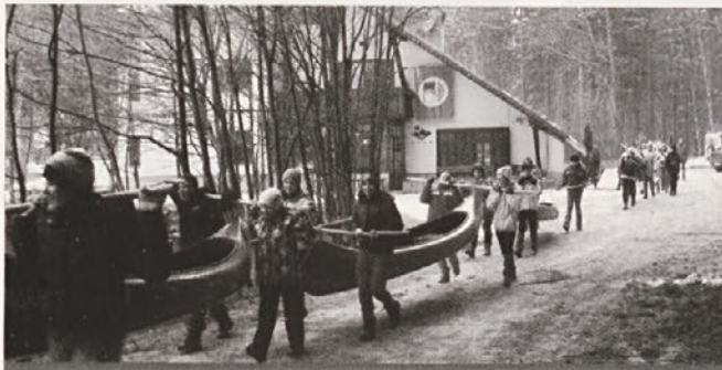
Kanuje in opremo je bilo potrebno prenesti do reke.

Prvi dan je imela prva skupina tek na smučeh. Pred Domom Rak smo se zbrali na klopeh. Odšli smo v brunarico, kjer nam je učitelj pokazal, kako se pripravijo smuči. Pokazal nam je tudi, kako se popravi kakšna vreznina v smučeh in kako je potrebno