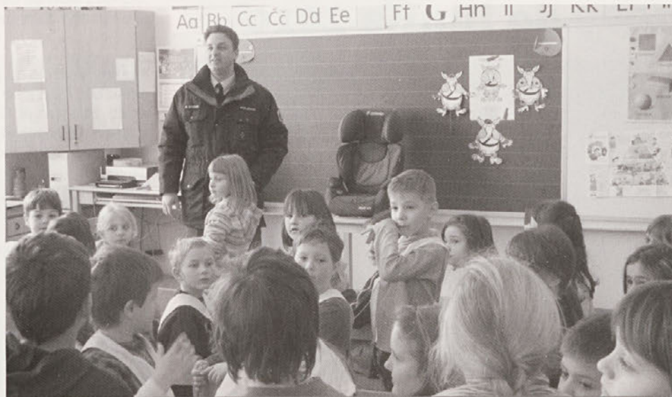
Osnovnošolce je obiskal tudi policist.

Bil je vroč dan. Pasavček je šel ven in videl nekaj neverjetnega. Otroci se v avtomobilu niso pripeli z varnostnim pasom. Rekel jim je, naj se pripnejo, a ga niso ubogali. Ko so