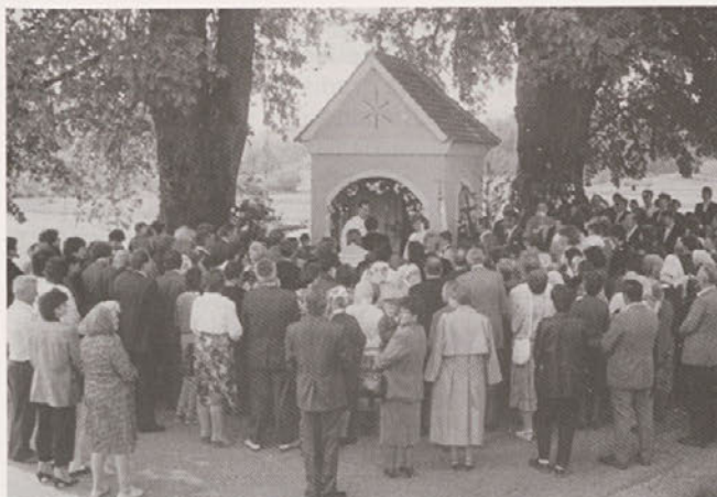
Bukovčova kapela v Cirkulanah. Fotografiral fotograf Langerhole s Ptuja leta 1991. Fotografijo hrani družina Žuran.