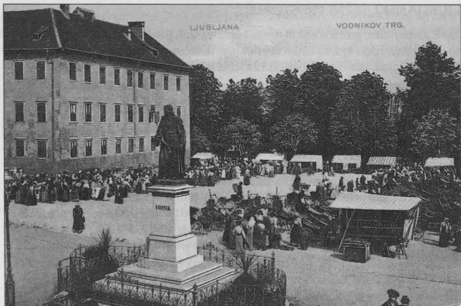
Vodnikov trg leta 1912. Konec 19. in začetkom 20. stoletja so na tem trgu ob letnih sejmih prodajali slaščice. • Vodnik Square in 1912 (picture postcard from the Tančič Collection). Round the turn of the century sweets were sold in the square during the annual fairs. • La Place de Vodnik en 1912. C'est la place où on vendait à la fin du 19e et au début du 20e siècle les pâtisseries aux foires d'été. (La carte postale de la collection de Zmago Tančič)

Kakšne stojnice in tržne lope so v posameznih obdobjih stale na ljubljanskih trgih, kako so bile razporejene in koliko jih je bilo, bi težko rekonstruirali, nekaj informacij pa iz arhivskega gradiva le dobimo. Iz cenika pristojbin za letne sejme iz leta 1858 razberemo, da so prodajalci lahko najeli magistratne stojnice ali postavili svoje. Na voljo so bile »velike sejemске lope, male lope, lope na kavaletu (verjetno na zlozljivih kozah), 'štanti na polici', posebne male stojnice za glavnikarje, prodajalce trakov in sukanca, in stojnice za sedeče kramarje s čipkami, škatlami in podobnim.« 7 Na Levstikovem trgu je ob posloplju Redute l. 1863 stalo 21 stojnic namenjenih prodajalcem ob tedenskih in letnih sejmih. Najemnina za leto dni je znašala 3 gld. in je bila plačljiva v dveh obrokih. 8 Lesene prodajalnice in štanti so stali tudi na Krekovem trgu in pred licejem. Tržne lope oziroma stojnice na ljubljanskih trgih so bile najverjetneje precej neugledne in neenotne.