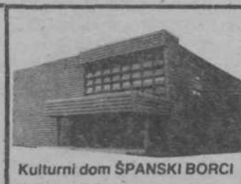
Kulturni dom ŠPANSKI BORCI