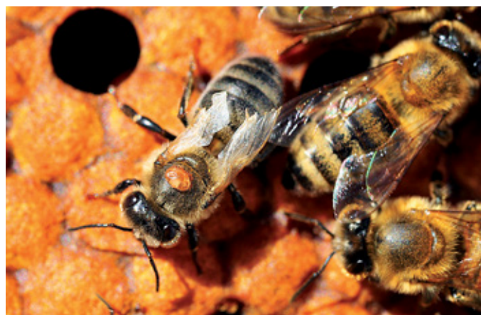
Jeseni je na odraslih čebelah vedno več varoj

Pregled naredimo na hitro, zanimata pa nas samo zaloga hrane in moč čebelje družine. V svojem čebelarstvu na čebeljo družino pokrmimo skupaj 12 kg sladkorja. Govorim