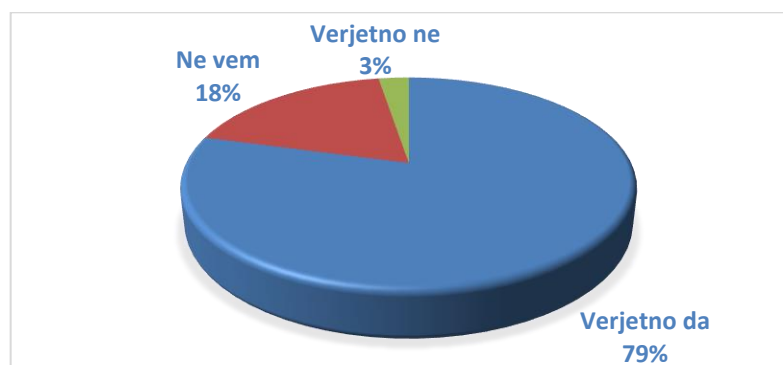
Slika 5: Verjetnost obiska literarnega večera

Tudi četrto vprašanje je bilo namenjeno ugotavljanju možnosti povezovanja z drugimi bralnospodbujevalnimi projekti, predvsem z literarnimi večeri, na katerih gostimo slovenske avtorje. Na vprašanje: Ali bi se (v okviru bralne značke) udeležili srečanja z avtorjem (ki je na seznamu)? je 61 vprašancev odgovorilo z Verjetno da, 14 z Ne vem in samo 2 z Verjetno ne.