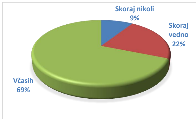
Slika 4: Pogostost izbiranja gradiva na podlagi seznama, ki ga pripravi knjižnica

Tudi četrto vprašanje je bilo namenjeno ugotavljanju možnosti povezovanja z drugimi bralnospodbujevalnimi projekti, predvsem z literarnimi večeri, na katerih gostimo slovenske avtorje. Na vprašanje: Ali bi se (v okviru bralne značke) udeležili srečanja z avtorjem (ki je na seznamu)? je 61 vprašancev odgovorilo z Verjetno da, 14 z Ne vem in samo 2 z Verjetno ne.