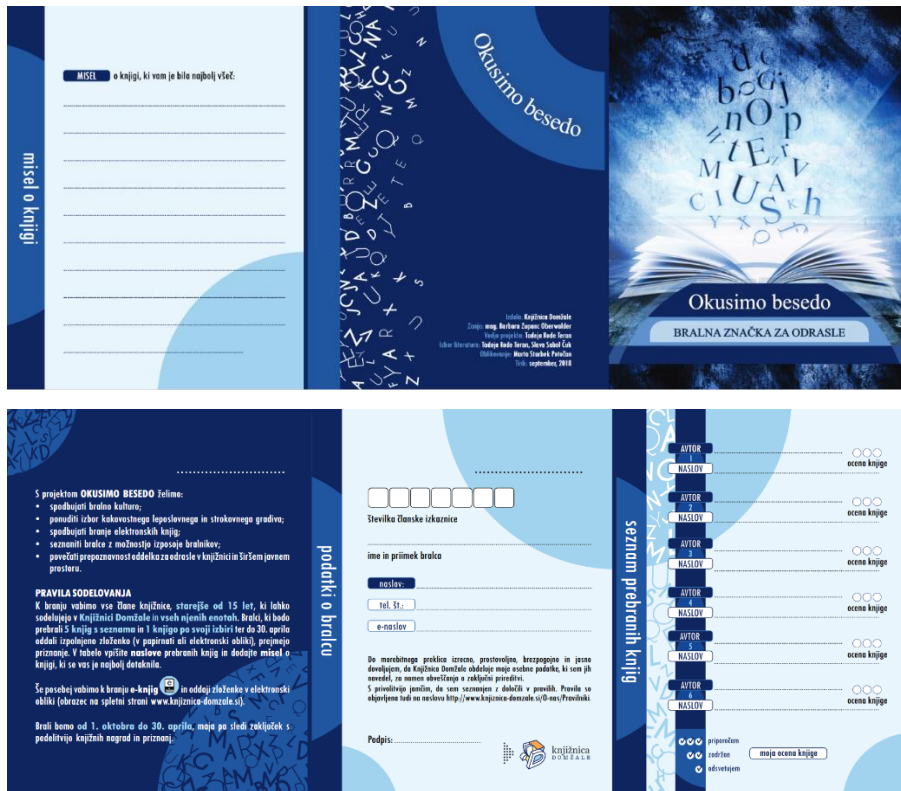
Slika 1: Primer zloženke

bralcem podelimo priznanja in knjižne nagrade. Prireditev je zelo priljubljena in vedno dobro obiskana, saj se trudimo predstaviti zanimive goste, ki so tako ali drugače povezani z literaturo.