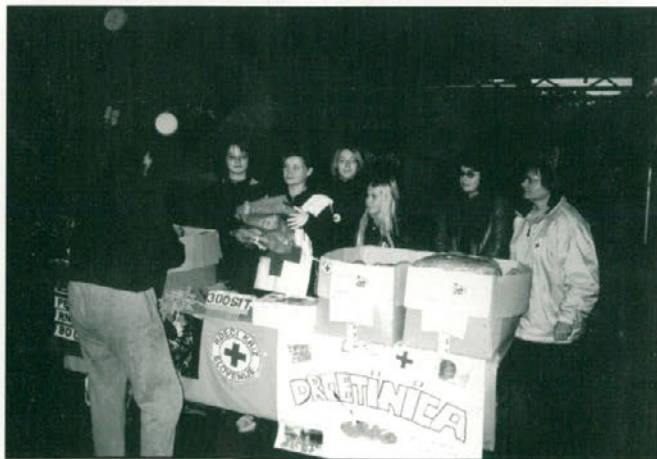
Utrinek iz projekta "DROBTINICA".

Projekt je potekal pod okriljem Krajevne organizacije Rdečega križa Majšperk. Izvedli smo ga 12. oktobra s prodajo kruha na treh stojnicah. Stojnice smo postavili v Majšperku, na Bregu ter Vrhah pred trgovino Smreka. Pri pripravi in organizaciji te mednarodne akcije so se odraslim pridružili tudi