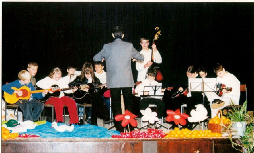
Prisotnim so zaigrali tamburaši KUD Majšperk.

Lokalno informativno glasilo DOBRE MARNJE dobi vsako gospodinjstvo brezplačno, za katerega izdajatelj plačuje 8,5% DDV (Uradni list RS št. 89/98).