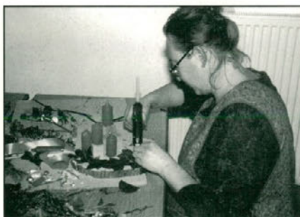
Utrinek z delavnice izdelovanja adventnih venčkov

Letos smo že drugo leto zapored KUD Majšperk in Karitas Majšperk organizirali delavnico izdelovanja adventnih venčkov.