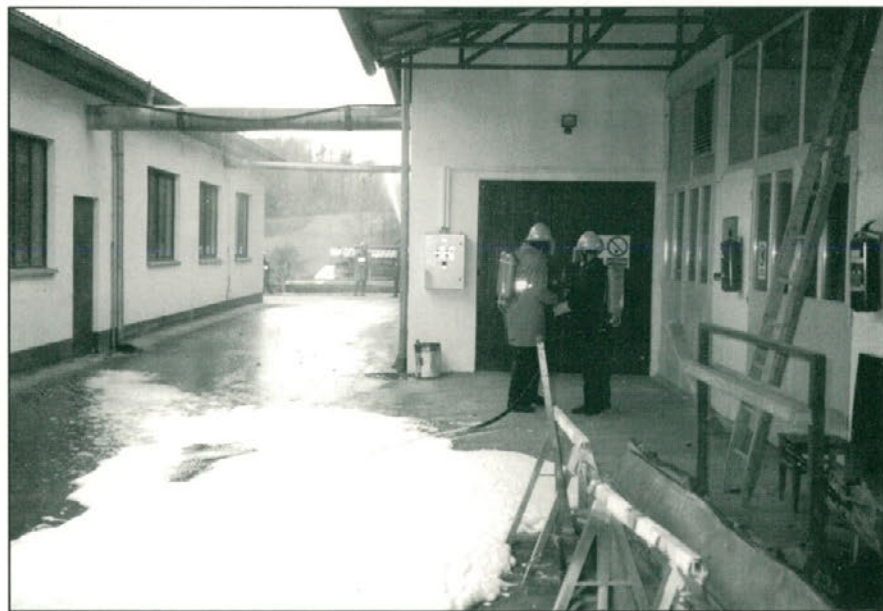
Utrinek z gasilske vaje PGD Majšperk

Po končani vaji je potekala analiza, iz katere je bilo ugotovljeno, da so operativci zadane naloge dobro opravili. Nimamo pa zadovoljive tehnike, kajti takšne vrste požarov lahko gasimo samo z visokim