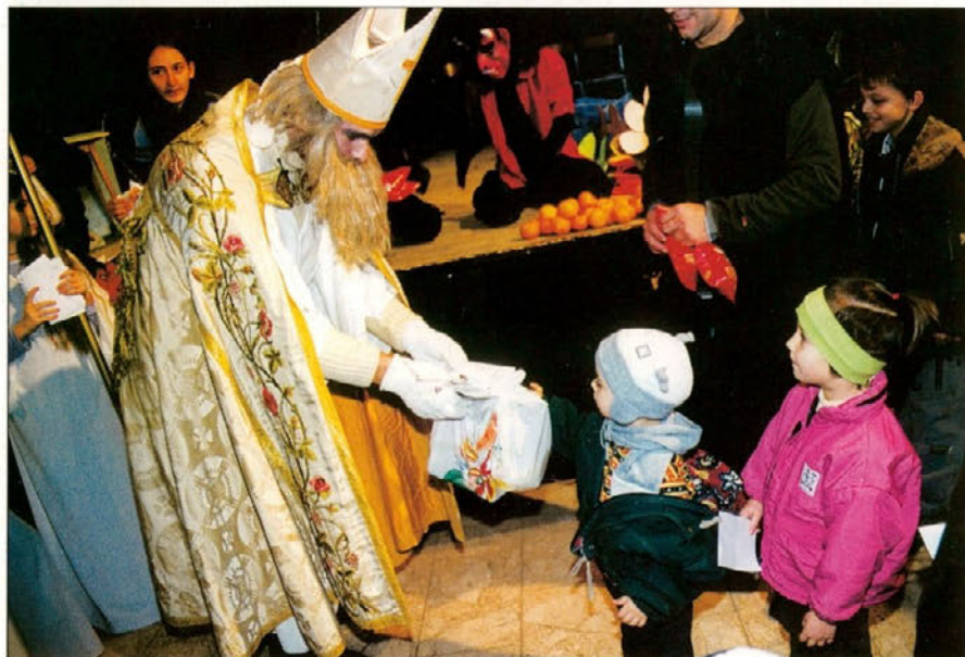
Otroci so se k Miklavžu napotili v spremstvu staršev, pa ne da bi se jih bali.

Sveti Miklavž je celo leto spremljal otroke in opazoval njihova dejanja. In ko je napočil njegov dan, je z veseljem obdaril vse pridne otroke.