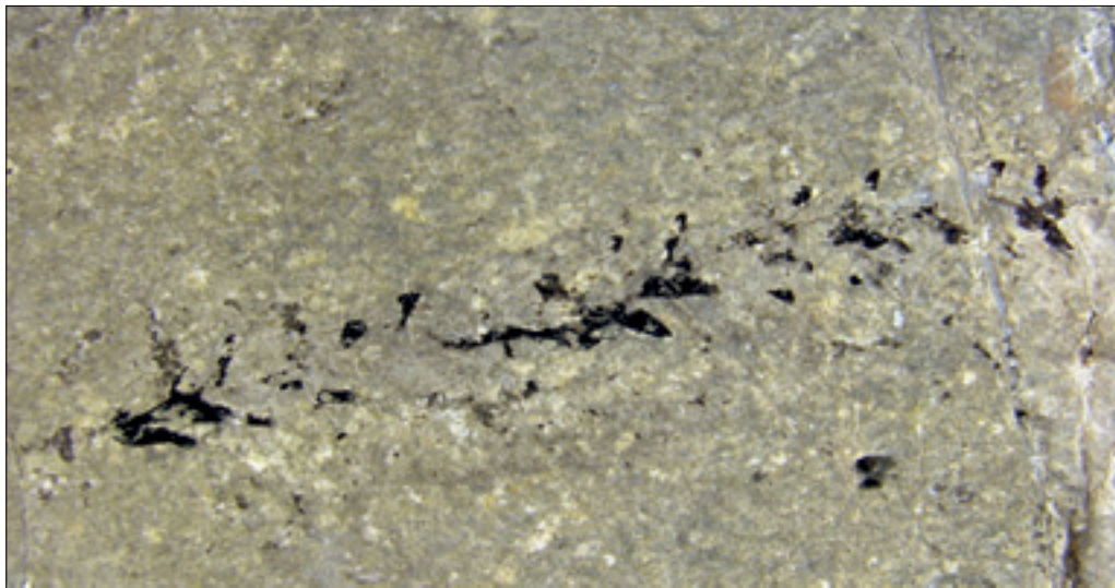
Vejica triasnega iglavca » Voltzia « (T-815), Strelovška formacija, dolžina 60 mm.

» Voltzia « conifer (T-815), Strelovec Formation, length 60 mm.