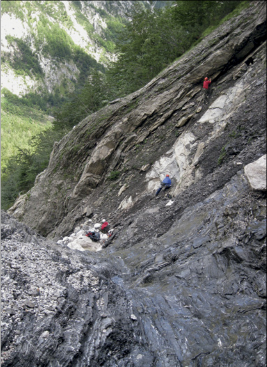
Nahajališče fosilnih vretenčarjev v plasteh Strelovške formacije. Outcrop with fossil vertebrates in the beds of Strelovec Formation.