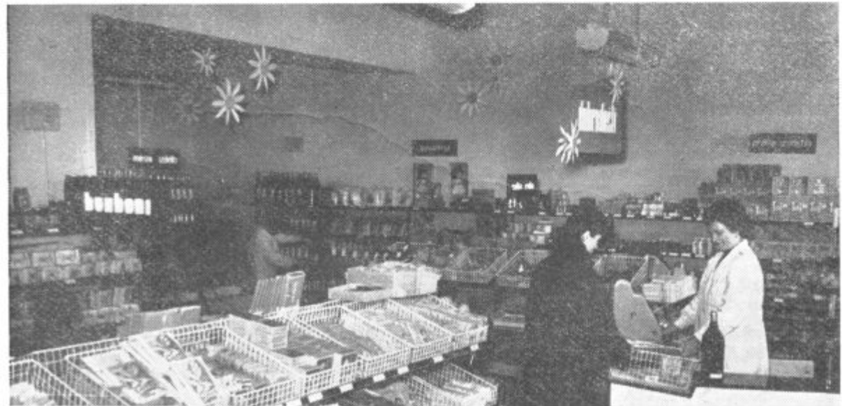
PRVA SAMOPOSTREŽNA TRGOVINA V OBČINI LENART — Trgovsko podjetje »Potrošnik« iz Lenarta je pred kratkim v trgu Lenart odprlo prvo samopostrežno trgovino s prehrabnenimi artikli v lenarški občini. Trgovina je založena z vsem, kar potrošniki iz občine Lenart potrebujejo in je odprta vsak dan od 7. do 12. ure in od 16. do 18.30 ter ob nedeljah od 7. do 9. ure dopoldne. Na sliki: notranjost nove samopostrežnice.