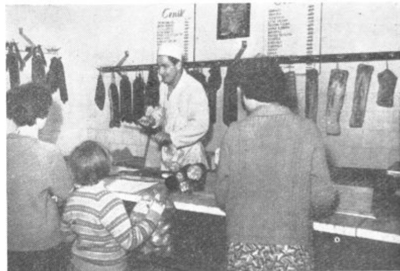
ŠE ENA MESNICA V LENARTU — Kmetijsko industrijski kombinat »Pomurka« iz Murske Sobote je pred kratkim v Lenartu odprl novo mesnico, ki je založena z vsemi vrstami mesnih izdelkov. Gospodinja se posebno zadovoljuje z veliko izbiro klobas. Na sliki: notranjost nove mesnice.

— Kaj misliš, kdo bo obnovil zgradbe v zgornjem koncu trga? — Občina vendar! — Kdo bo pa tistim ustanovam in podjetjem kupil napisne table, ki jih še nimajo? — Kdo drugi kot občina. — Zdaj mi pa še povej, zakaj vse občina? — Zato, ker se prizadeti ne spomnijo sami.