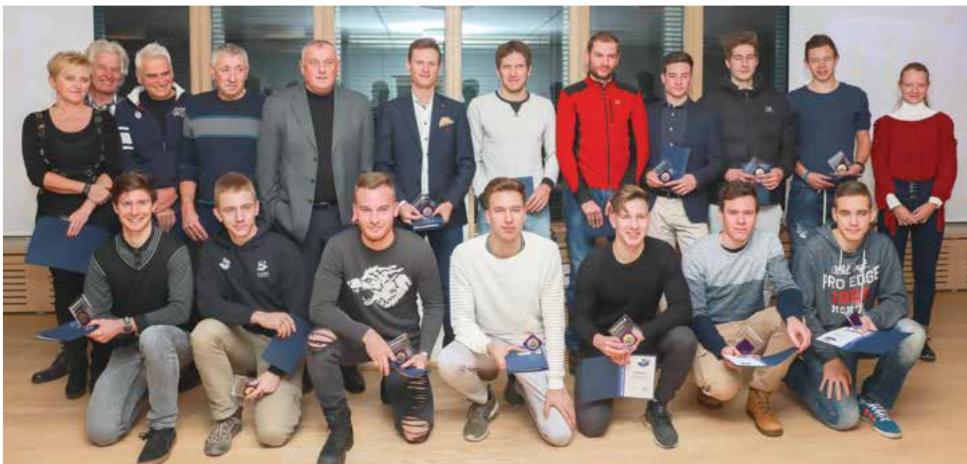
Kolesarji in strokovno vodstvo kluba