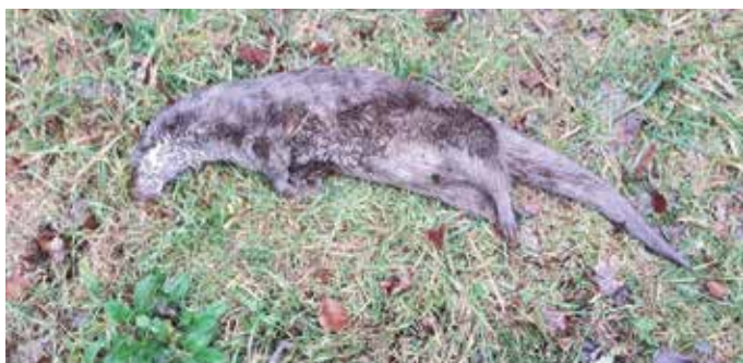
Povožen samec vidre

Leta 2018 je bilo tako na cesti ali železnici povoženih 36 osebkov srnjadi, trije mufloni (prvič v zgodovini) in en osebek jelenjadi, kar predstavlja skupno tretjino načrtovanega letnega odvzema iz lovišča Bled. Zaradi preostalih vzrokov, ki so predvsem bolezn, poškodbe, zveri, kosilnica, psi brez nadzora itn., je lani poginilo 25 osebkov srnjadi, 7 osebkov jelenjadi, trije mufloni in en gams, kar predstavlja več kot četrtno načrtovanega letnega odvzema iz lovišča. Tako visokih izgub v preteklosti še nikoli nismo zabeležili. V letu 2018 smo tri osebkove divjadi (srnjak, muflon in gams) poslali tudi na Inštitut za patologijo Veterinarske fakultete, da bi ugotovili vzroke pogina. Pri srnjaku je bila ugotovljena zastupitev s pokvarjeno krmo, ki jo je zaužil v neposredni bližini naselja. Med vzroki za izgube smo žal zabeležili tudi primer nezakonitega lova, ki smo ga prijavili Policijski postaji Bled. Kot največjo zanimivost v letu 2018 moramo izpo-