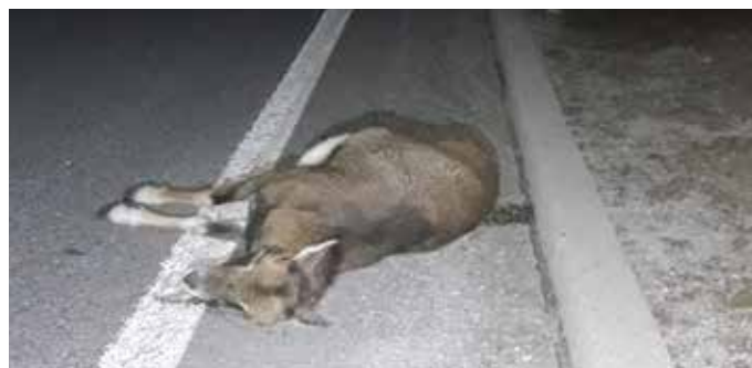
Povožena muflonka v Mačkovcu