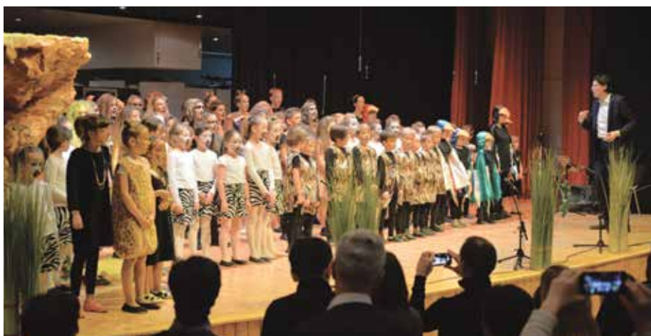
Levji kralj, 18. december 2018

Praznični koncert pa je bil v tem letu nekaj posebnega, saj je Glasbeni center DO RE MI v letu 2018 slavil 10-letnico delovanja. V ta namen so učitelji, mentorji in zunanji sodelavci pripravili muzikal Levji kralj, v katerem je nastopila velika večina učencev od 1. do 8. razreda solfeggia. Priprave na ta zahteven projekt so se začele že poleti v Adergasu, v mesecu decembru pa so se stopnjevale. V ponedeljek smo najprej izvedli delovno predstavo, ki so si jo ogledali predvsem