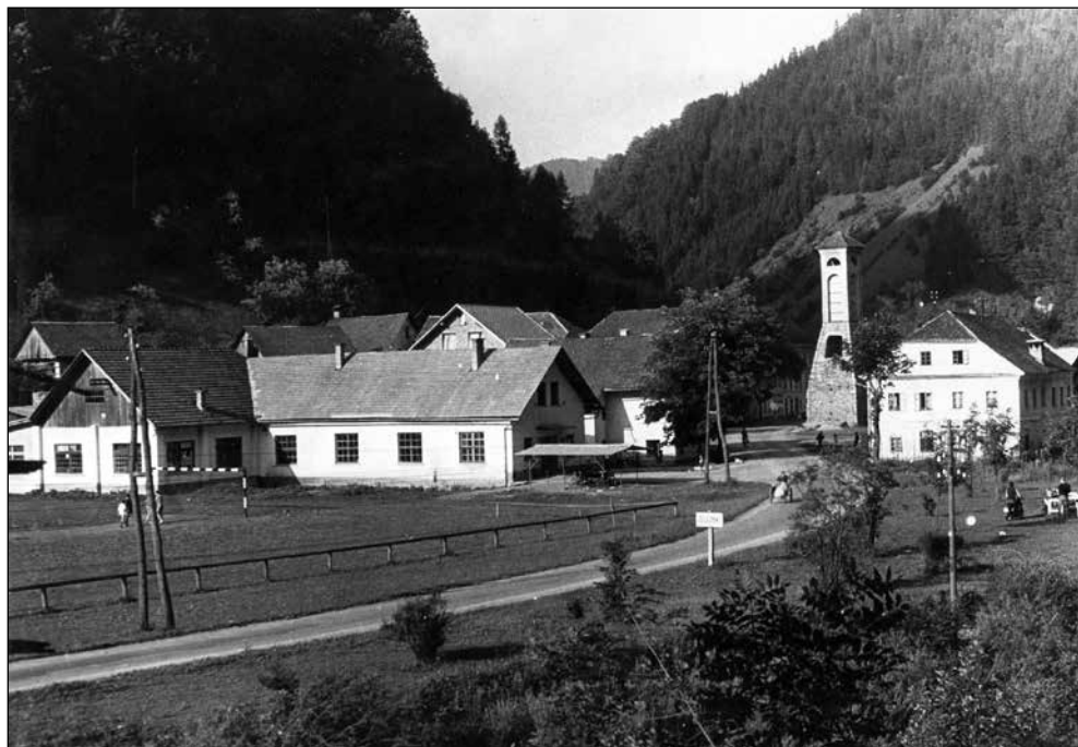
Prostori sodarske delavnice v Železnikih, sredi 20. stoletja.

V tridesetih letih 20. stoletja do druge svetovne vojne so izdelovali: sode za zelje, za kolomaz, za ke-