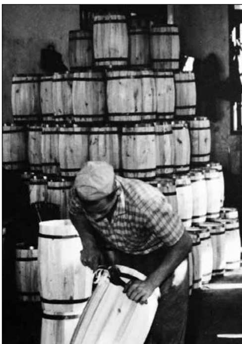
Sodarji pri delu.