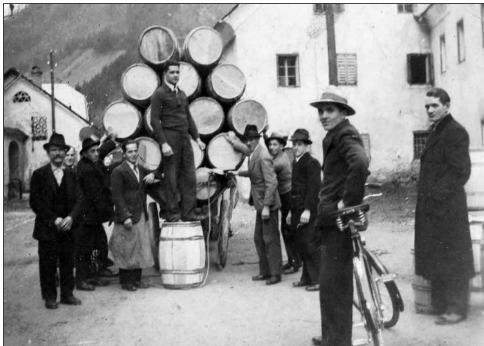
Voz s sodi pred Plavčevo hišo v Železnikih.