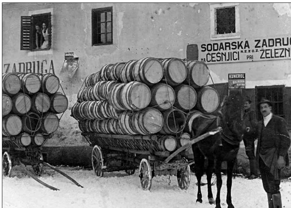
Lojtrnk, naložen s sodi, pred zadružno stavbo na Česnjiči.