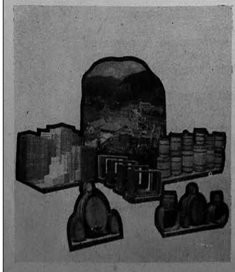
Oglas, objavljen v Loških razgledih leta 1956.

Izdeluje vse vrste rezanega lesa, specialne mizarske izdel- ke, embalažne sode in zaboje