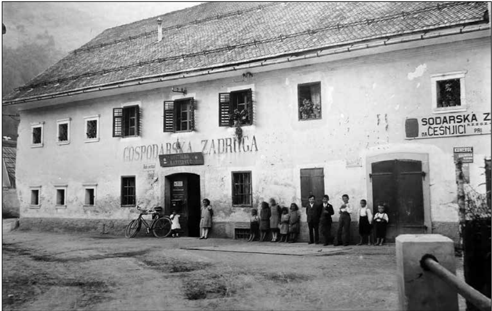
Poslopje nekdanjega Markovega grunta na Česnjiči, kjer sta imeli prostore Gospodarska in Sodarska zadruga.