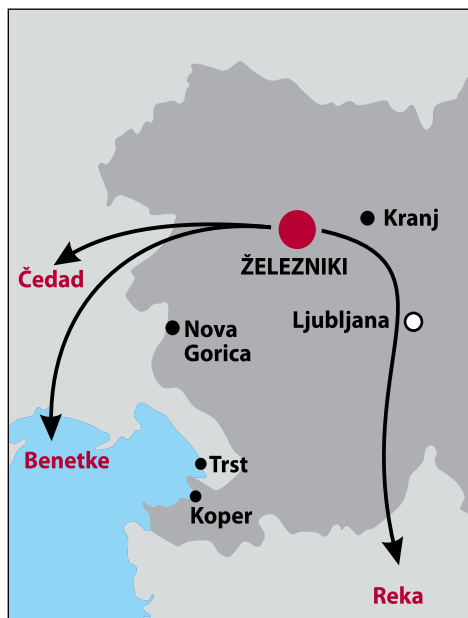
Zemljevid trgovskih poti s kovanimi izdelki.