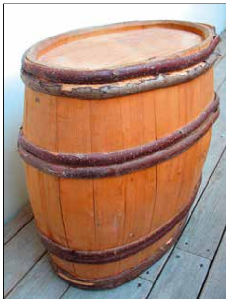
Barigla. Hrani Muzej Železniki. Foto: Katja Mohorič Bonča

Trgovske poti, ki so vodile iz Železnikov predvsem do jadranskih pristanišč, so bile sprva ozke in primerne za tovarništvo – prevoz s konji. Tovorniki so se za potovanje iz varnostnih razlogov in zaradi medsebojne pomoči združevali v karavane. Dve barigli, napolnjeni z žebli, sta predstavljali en tovor. Zanj je bilo treba v mitnicah plačati enotno mitnino. 6 Ko so zgradili širše ceste, so bili za prevoz izdelkov veliko primernejši vprežni vozovi. Trgovina z žebli je potekala proti zahodu čez Bačo, Most na Soči, Gorico, Štivan do Benetk in Trsta ter proti Severni Italiji preko Kobarida, Čedadada in Vidma. V 17. stoletju je za kovane izdelke postalo pomembno pristanišče na Reki. 7