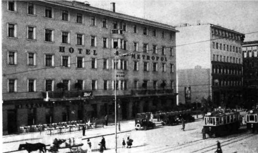
Hotel Metropol-Miklič v Ljubljani

Garaže so na dvorišču, kjer je tudi velika mehanična delavnica za popravilo avtomobilov. Na dvorišču je tudi prostor za avtobuse.