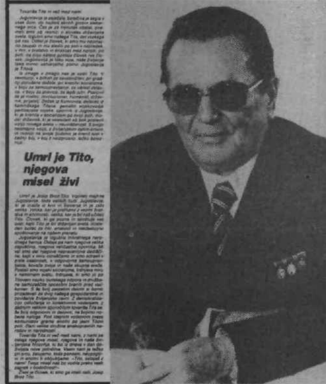
Umri je Tito, njegova misel živi

Organizacije in ustanove, delovne ljudi in občane obveščamo, da lahko namesto vencev in cvetja poklonijo prispevek v: - Titov sklad za štipendiranje mladih delavcev in otrok delavcev v SR Sloveniji 50100-655-50108 Ljubljana.