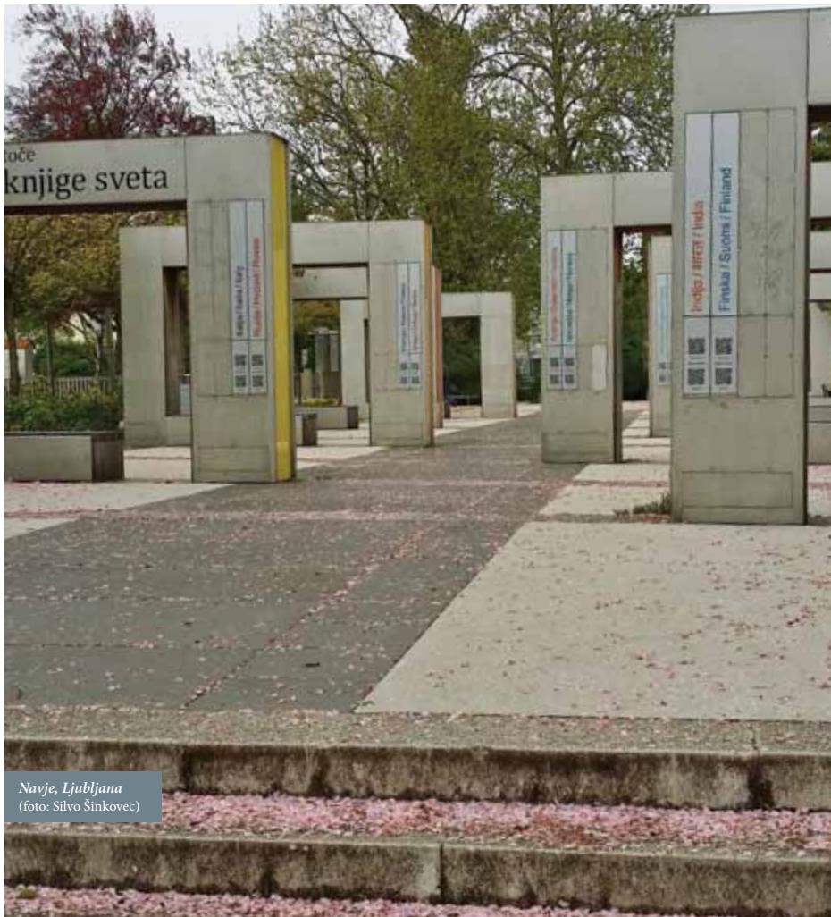
Navje, Ljubljana