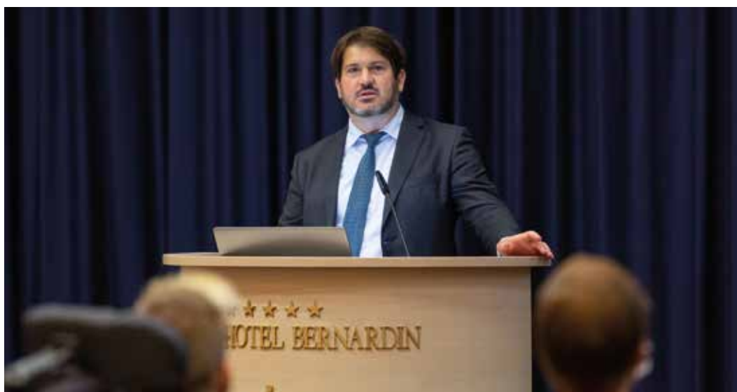
Na dnevih Socialne zbornice Slovenije je Miha Lobnik, zagovornik načela enakosti predstavil delovanje Zagovornika na družbeni ravni, s poudarkom na področju socialnega varstva.

Predstojnik Zagovornika Miha Lobnik je 8. oktobra 2021 na XXVII. dnevih Socialne zbornice Slovenije v okviru okrogle mize Protislovja enakih možnosti predstavil zakonske pristojnosti in naloge Zagovornika kot neodvisnega samostojnega državnega organa, specializiranega za varstvo pred diskriminacijo. Pojasnil je, kako Zagovornik ljudem svetuje in ugotavlja diskriminacijo v posameznih primerih. Predstavil je delovanje Zagovornika na družbeni ravni, s poudarkom na področju socialnega varstva.