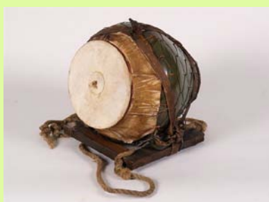
Lončeni bas vrbiškega `zeljenega Jurija`