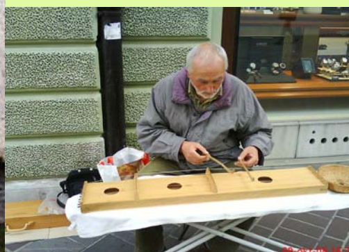
Na ulicah Ljubljane: oprekelj