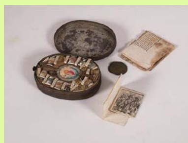
škapulir, amulet vojaka v. 1. svetovni vojni