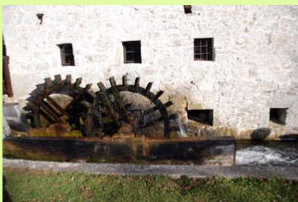
Trubarjeva domačija in mlin