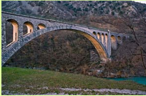
Solkanski most, najdaljši kamniti most na svetu (primer materialne kulture)