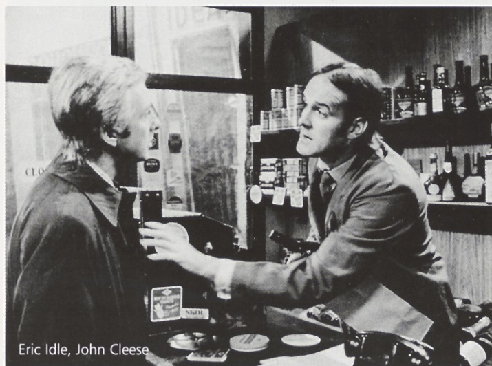
Eric Idle, John Cleese

Prav zaradi svoje "učinkovitosti" je zahodna družba pokrov, pod katerim se kuhajo mnoga zatrta občutja; civilizacija pa vse prepogosto spominja na lik policajca, ki s svojim pendrekom nadzoruje cele eskadronne poneumljenih človeških duš. Obstaja mnogo primerov, da celo umetnost, ki si prizadeva, da bi iznašla