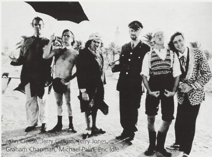
John Cleese, Terry Gilliam, Terry Jones, Graham Chapman, Michael Palin, Eric Idle

prekrižal noge, prevrnil žaro in razsul prah po oblekah ostalih udeležencev! Potem je Terry Jones s "studom" stresel svoj sako, Eric Idle pa je ostanke Chapmanovega prahu tlačil pod preprogo. Brutalni humor? Bog obvaruj. To je le tipično pythonovsko posmehovanje družbenim normam.