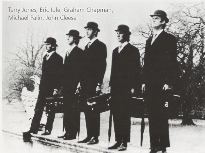
Terry Jones, Eric Idle, Graham Chapman, Michael Palin, John Cleese