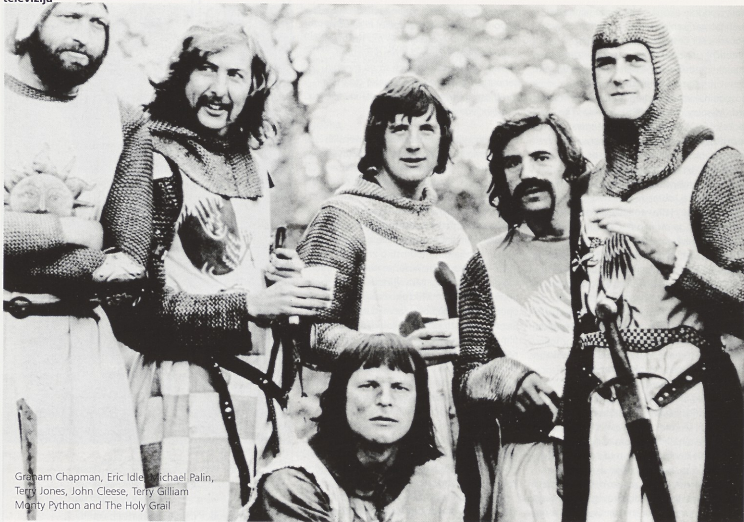
Graham Chapman, Eric Idle, Michael Palin, Terry Jones, John Cleese, Terry Gilliam Monty Python and The Holy Grail