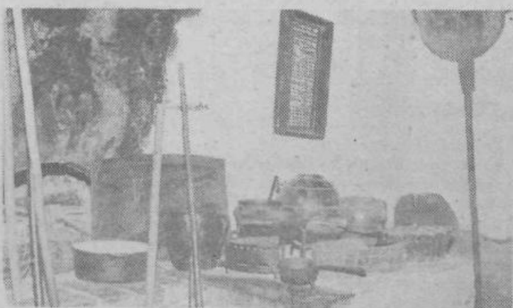
Rojstna hiša Josipa Jurčiča — notranost