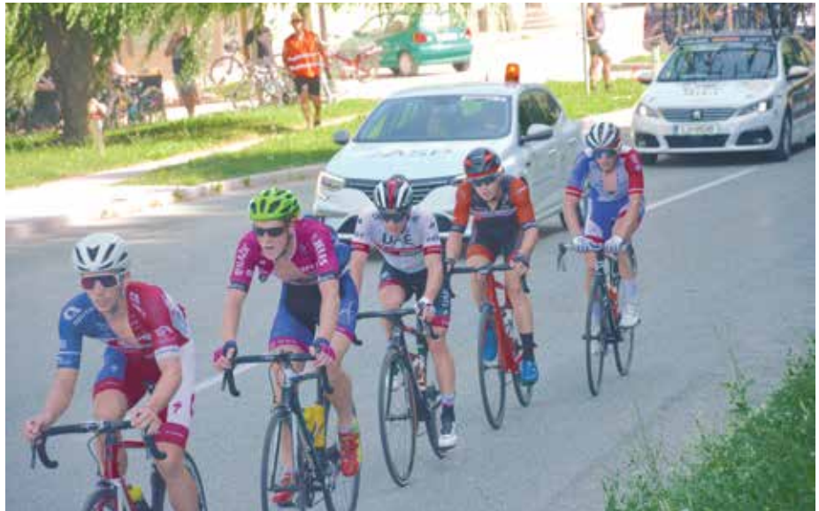
KK Bled (drugi z leve) je odlično nastopil v močni konkurenci.

Izjemna predstava nastopajočih, zlasti borbenost za prestižne naslove državnih prvakov so navdušile številne navijače ob vsej progi. Morda najbolj vroče vzdušje so pripravili gledalci na skoraj 20 % vzponu na Zgornjo Dobravo in pa na zadnjem vzponu pod Radovljico. Pravo kolesarsko vzdušje je bilo ves dan tudi na štartno-