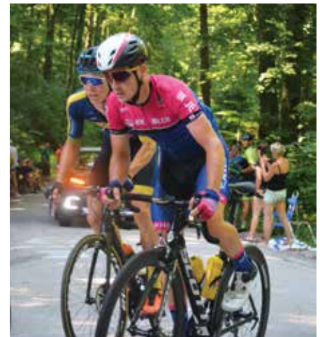
KK Bled, na vzponu na Zgornjo Dobravo, je bil na začetku dirke v ubežni skupini.