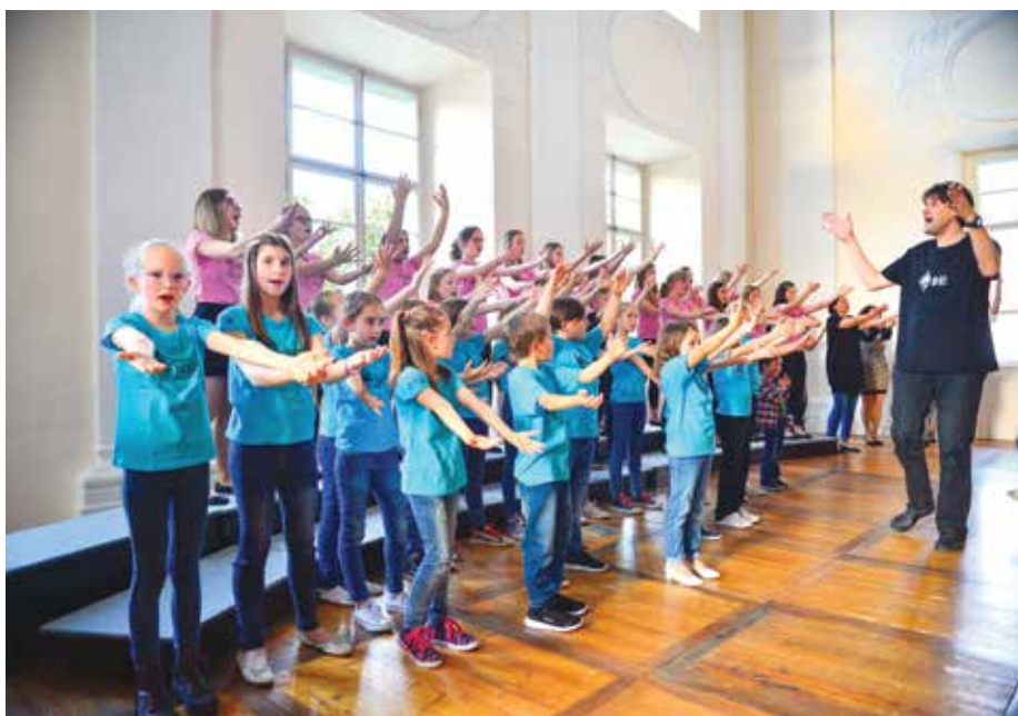
Mladinski pevski zbor DO RE MI in Otroški pevski zbor DO RE MI, Letni koncert zborov DO RE MI, 23. maj 2019, Baročna dvorana Radovljica

Ob koncu šolskega leta smo s predstavo Palček Smuk razveselili otroke iz vrtca Brezje. V predstavi so z Gašperjem in Nalom nastopili učenci nižjih razredov in nekateri naši učitelji. Po končani predstavi so se vsi skupaj družili na pikniku na vrtčevskem vrtu. Učenci glasbenega uvajanja in prvega razreda solfeggia so ob zaključku šolskega leta v avli OŠ Bled pripravili zaključni nastop, na katerem so zapeli in zaigrali skladbice, ki so se jih naučili čez leto. Sredi meseca junija