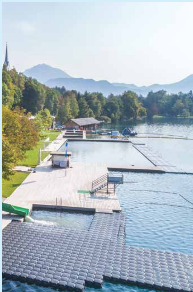
Grajsko kopališče