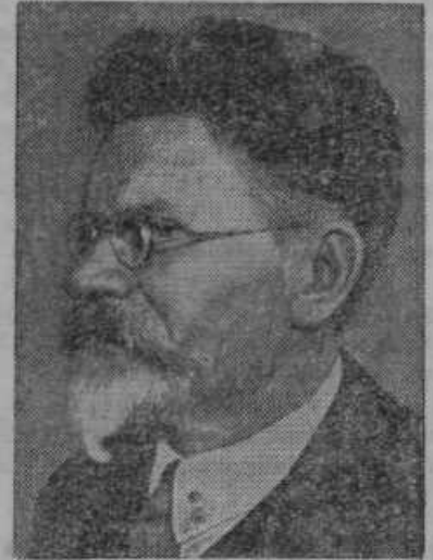
Kallina so izvolili za predsednika vrhovnega sovjetskega sveta.