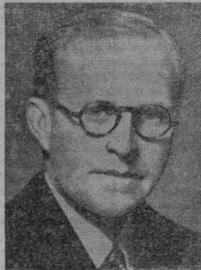
Jožef Kennedy, novi poslanik ameriških Združenih držav v Londonu, od katerega Evropa veliko pričakuje.