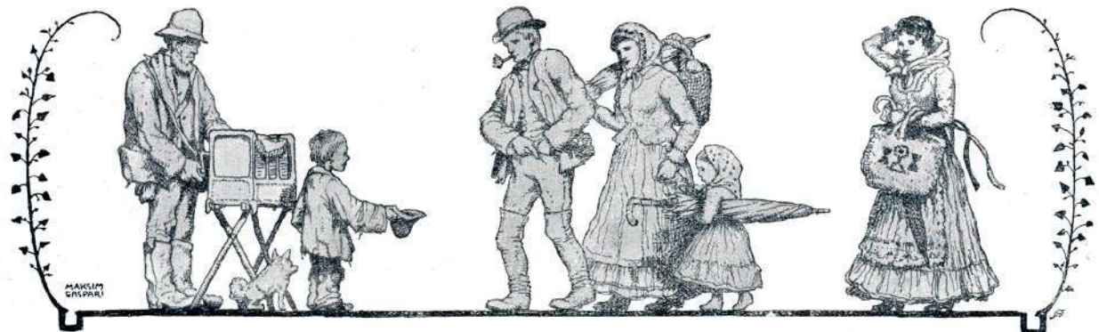
NA BOŽJO POT

ki bodo metali razstreliva na zemljo. Naša slika (str. 432) nam kaže vojni zrakoplov, ki ga je Rusija naročila na Francoskem v delavnici Lébaudy in ki je zgrajen po vzorcu francoskega zrakoplova „République“. Dolg je 52 m, obsega 3700 kubičnih metrov in ima Panhard-Levassorjev motor 80 konjskih sil, ki mu da pri ugodnem zraku brzino 60 km na uro.