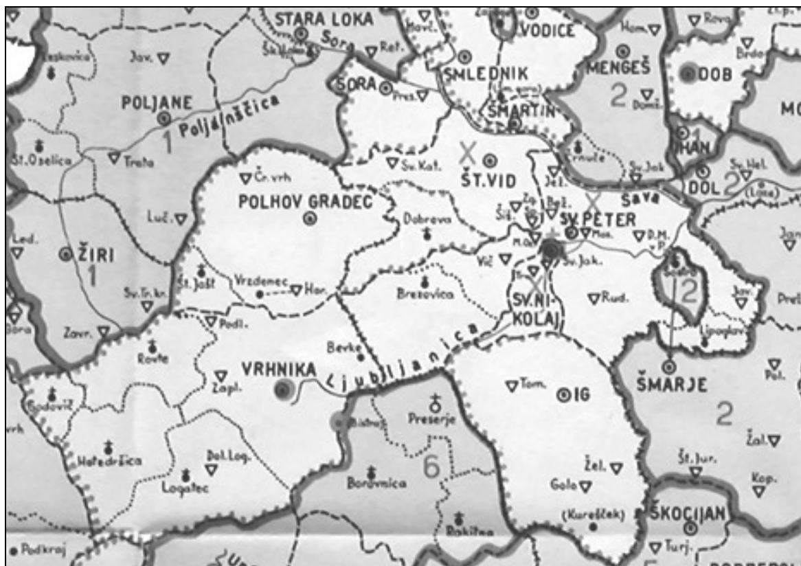
Šempetrska in sosednje župnije pred reformami 1782–1785 (iz M. Miklavčič, Predjožefinske župnije na Kranjskem /.../, Ljubljana 1945, priloga, izsek).

Preden se posvetimo vizitaciji, v ogledalu katere naj bi se nekoliko поблиže seznanili z dušnimi pastirji pri ljubljanskem Sv. Petru, se kratko pomudimo pri vprašanju, kaj se je leta 1631 dogajalo v evropskem prostoru, posebej v (rimsko) katoliški