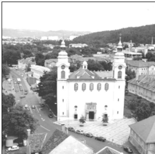
Župnijska cerkev sv. Petra danes.