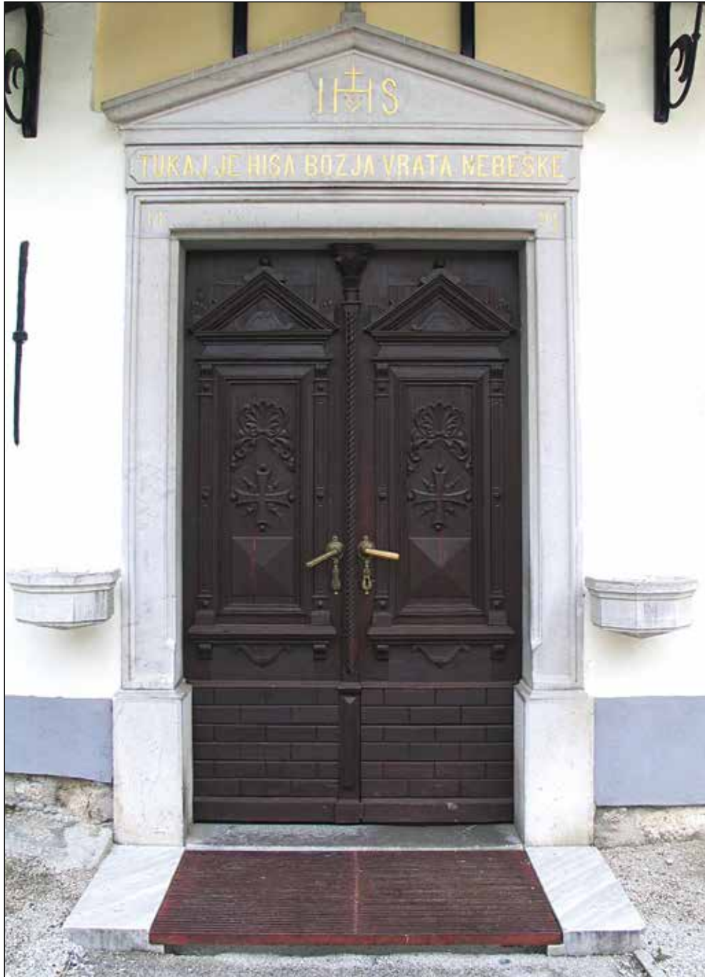
Vhodna vrata v župnijsko cerkev na Zalem Logu.