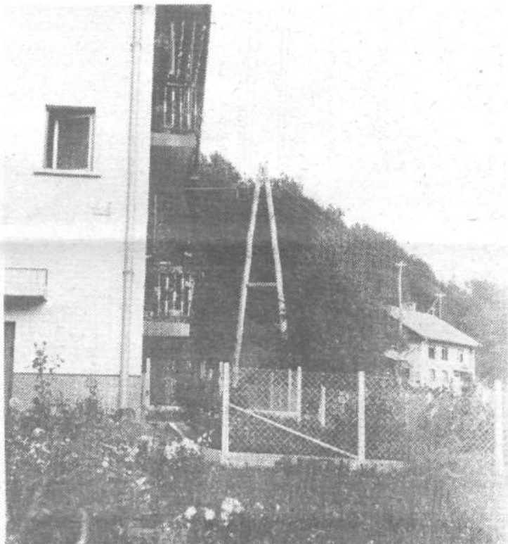
Skoraj šest kilometrov novega električnega voda so potegnili po Stranski vasi