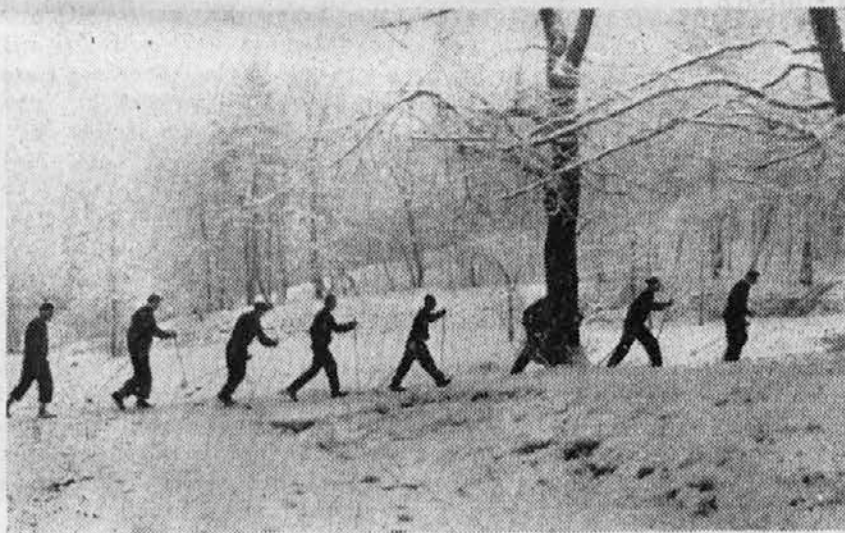
Smučarji na »suhem« trenlgu

Dunajčani so na glasu, da si radi privoščijo zabave, veselja in počitnic. Letos je šlo na poletni oddih nad 90 odstotkov meščanov. Ena tretjina je odpotovala v tujino, in sicer največ v Italijo.