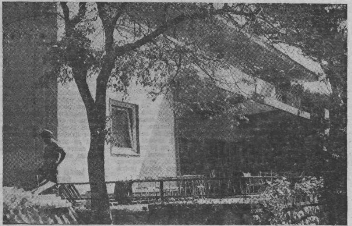
Pogled na vhodno stran nove letoviške zgradbe v Banjolah, kjer so sobe opremljene z vsem udobjem