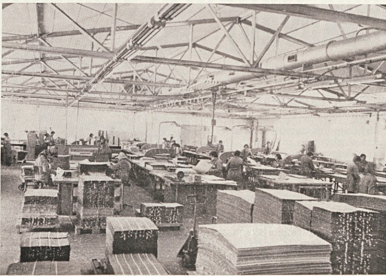
Proizvodna hala v TOZD GABER

nemoteno oskrbovali, predvsem iz prevelikih zalog in sprotnega dokončevanja manjkajočih kuhinjskih elementov. Iz tega je videti, da bo zaloga gotovih izdelkov padla na najmanjšo možno mero, dodatno akcijo pa bomo morali izpeljati na področju repromaterialov, posebno neidolih. Določene uspehe smo že dosegli pri znižanju zalog neidolih ultrapasov.