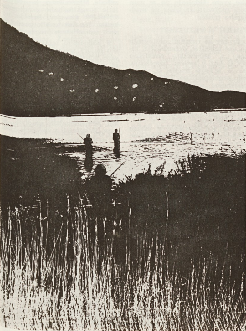
Ob Cerkniškem jezeru

Sedaj so v razpravi dokumenti za 10. kongres slovenskih in za (Konec na 2. strani)