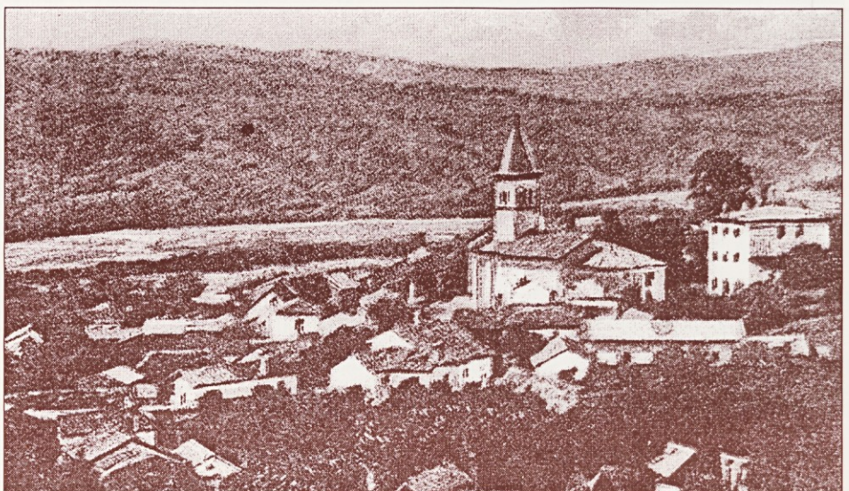
Ljudska šola v Jelšanah, desno ob cerkvi.

V razredu je bilo nad 30 otrok, dečkov in deklic, po dva razreda skupaj - kombinirano. Šolski okoliš je tedaj zajemal vasi: Jelšane, Dolenje in Rupa. Otroci so bili oblečeni v pisana oblačila: srajčke, majice, krilca, kratke in dolge hlače z eno naramnico ali dvema, nekateri so bili bosí,