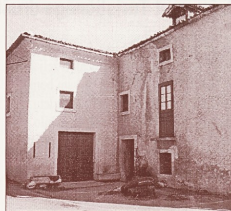
Hodnikov mlin v Ilirski Bistrici

V spodnjem prostoru galerije pripravljamo občasne tematske razstave. Zadnja je bila