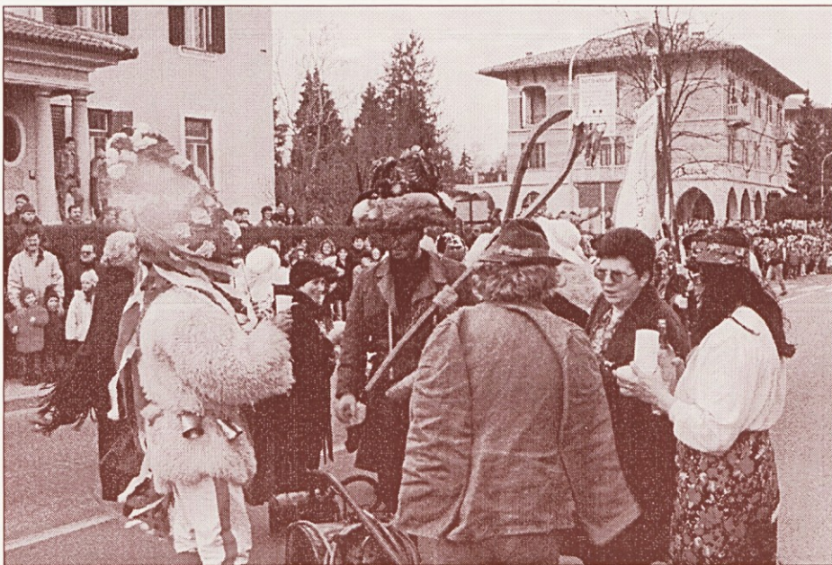
Prišel je pust - pust je pršu, Ilirska Bistrica 1998

Vino vrhunske kvalitete nam je za ta jubilej podarilo podjetje Primorje. Veselje je trajalo do jutranjih ur, kot se za tako priliko spodobi. Imeli smo visoke goste iz Turistične zveze Slovenije, ki je našemu društvu podelila zlato plaketo v znak priznanja. K poroki in kolaču sodi tudi nevestina bala. V prostorih galerije smo pripravili dve razstavi.