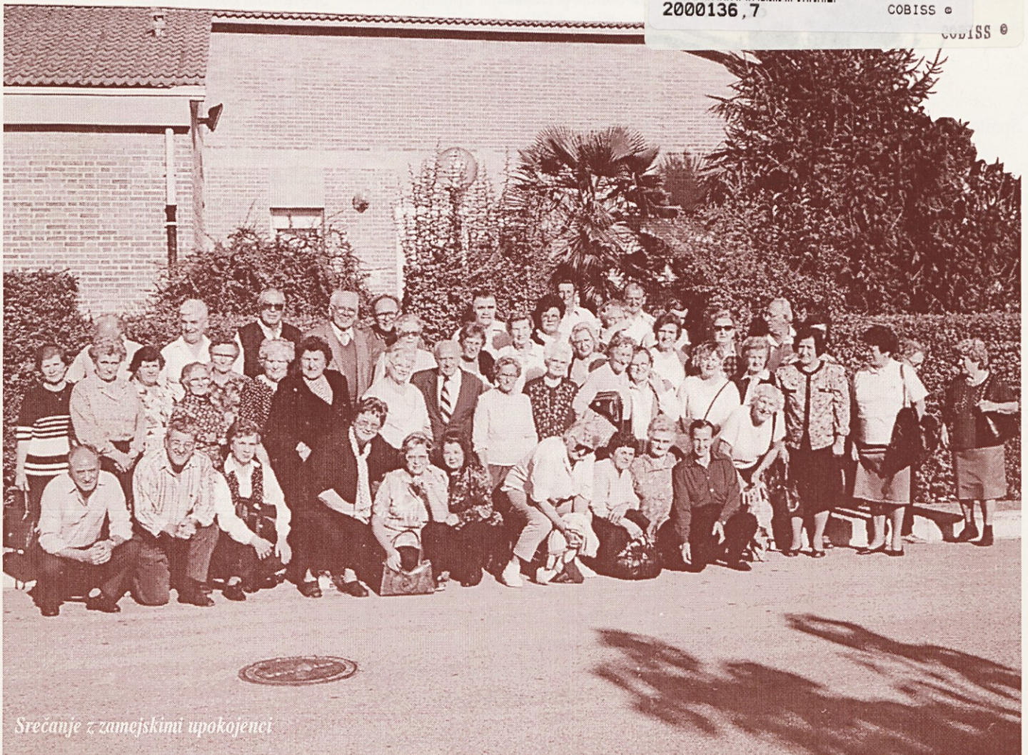
Srečanje z zamejskimi upokojenci