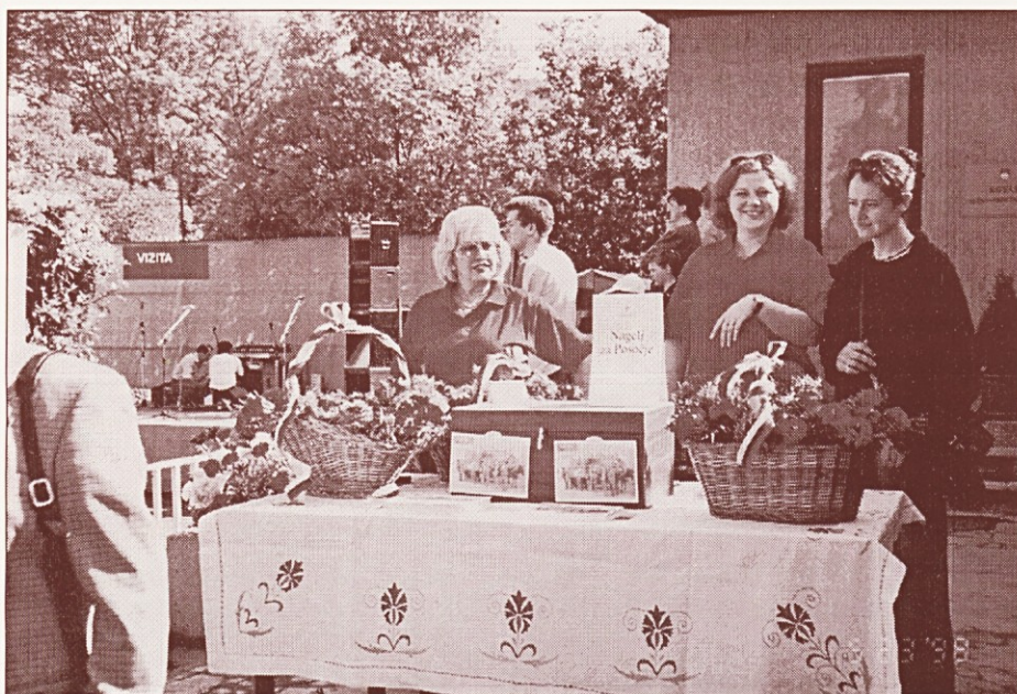
Vizita 1998 - Nagelj za Posočje