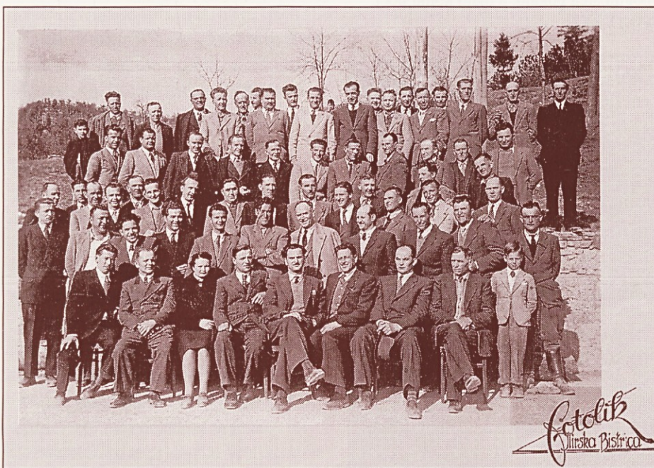
Slika v spomin na zasedanje Delavskega sveta podjetja Javor v Ilirski Bistrici dne 29. marca 1953