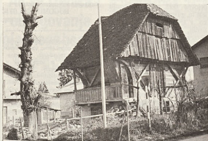
V Novem mestu ob Trčinovi cesti se postavlja ena zadnjih lesenih hiš. V spodnjem podzidanem delu je bilo stanovanje, zgornji leseni pa je služil kot pod. Fotografija kaže tudi na mojstrstvo nekdanjih tesarjev. S hišo so vzeli slovo tudi trije košati divji kostanji.