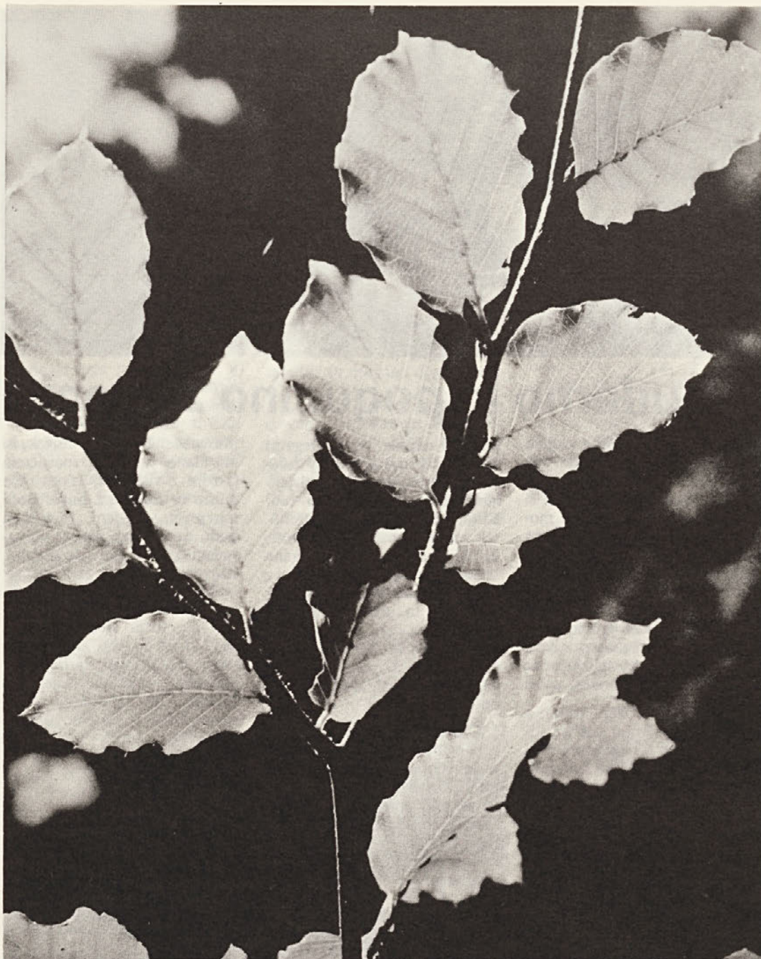
Spomladanska bukev – mati gozda . . .