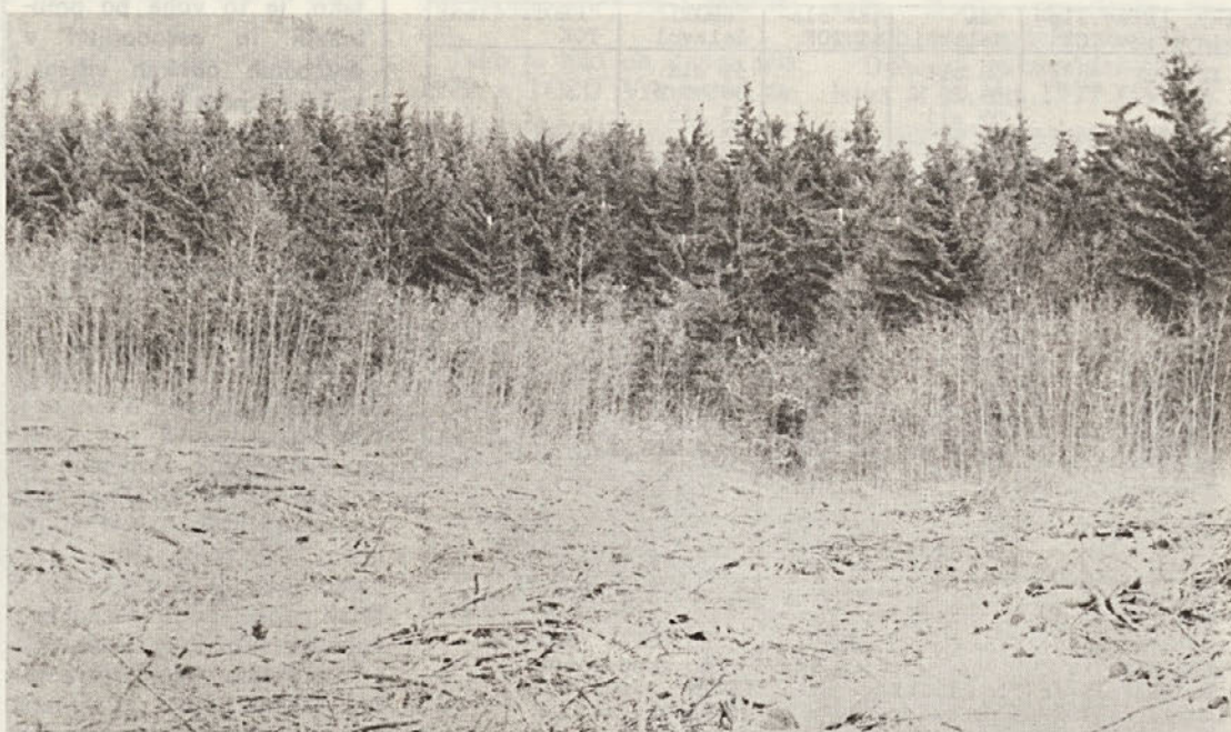
Sprejaj je viden končni posek bukovine v odd. 8 v G. E. Gorjanci, zadaj pa bele lise v smrekovem sestoju kažejo snegolom.