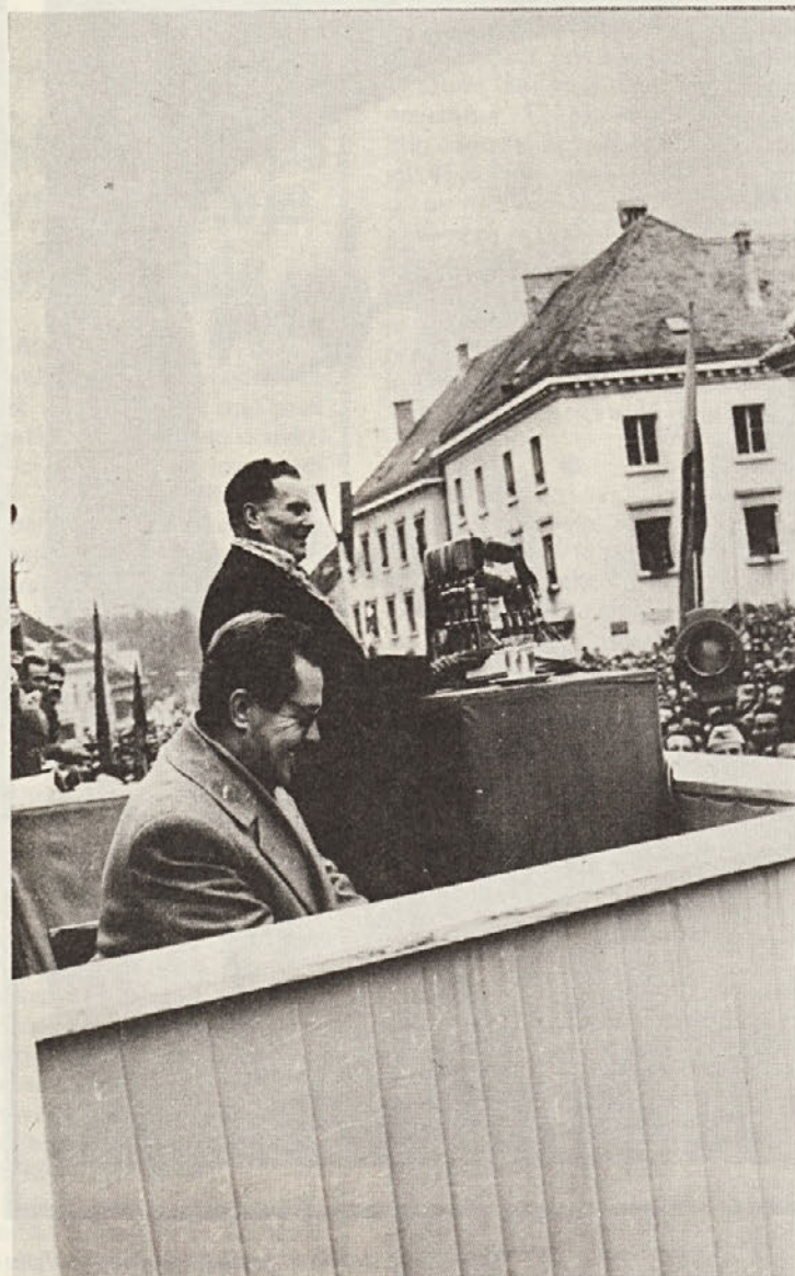
23. november 1958: predsednik Tito govori na velikem zborovanju v Novem mestu ob otvoritvi avtomobilske ceste Ljubljana – Zagreb