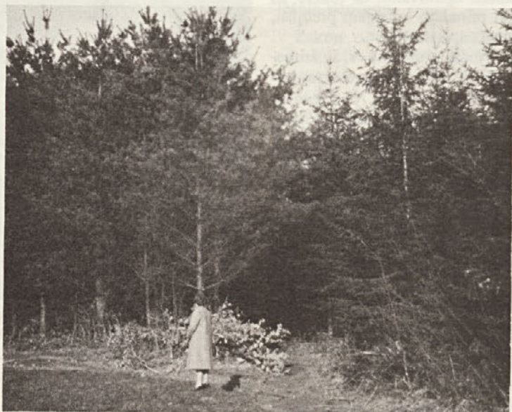
Stikališče dveh drevesnih vrst v nasadu – zelenega bora in smreke (foto: ing. Slavko Klančičar).

Tako je bilo ob koncu leta 1979 v TOZD Vrtnarstvo za-