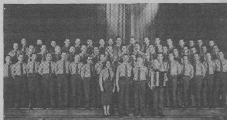
Eden prvih nastopov partizanskega pevskega zbora v Ljubljani