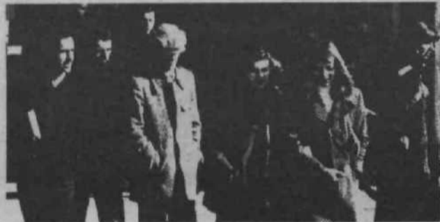
Ta ugotovitev, ki je vsekakor nesporna, je le izkristalizirano mnenje, ki pa mu mora slediti analiza:

Toliko resolucija! Pa vendar kljub vsem opredelitvam stanje na področju mentorstva še zdaleč ni zadovoljivo. Delovna skupina pri Komisiji za vzgojo, izobraževanje in raziskovalno dejavnost pri KZSMJ je preučevala ta problem in prišla do naslednje ugotovitve: »Pojav kategorije »zadolženih učiteljev« za delo ZSM se negativno odraža v samoupravnem in družbenopolitičnem delovanju učencev. Često so to učitelji, ki nimajo zadostnega števila ur, z mentorstvom (t. j. z delom z mladino) pa svoj potreben fond ur napolnijo. Redko pa so to mladi učitelji, člani ZSM, ki naj bi se tvorno vključili v delo OO ZSMS.«