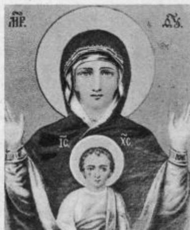
Z ljubim Sinom nas blagoslovi.

Če pa berem eno in isto stvar enkrat, in potem še enkrat in še enkrat ... tretjič,