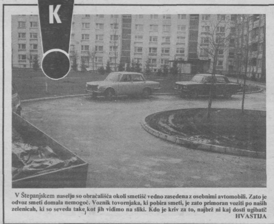
V Štepanjskem naselju so obračališča okoli smetišč vedno zasedena z osebnimi avtomobili. Zato je odvoz smeti domala nemogoč. Voznik tovornjaka, ki pobira smeti, je zato primoran voziti po naših zelenicah, ki so seveda take, kot jih vidimo na sliki. Kdo je kriv za to, najbrž ni kaj dosti ugibati! HVASTIJA