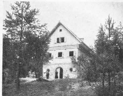
Naša koča v Zingariči