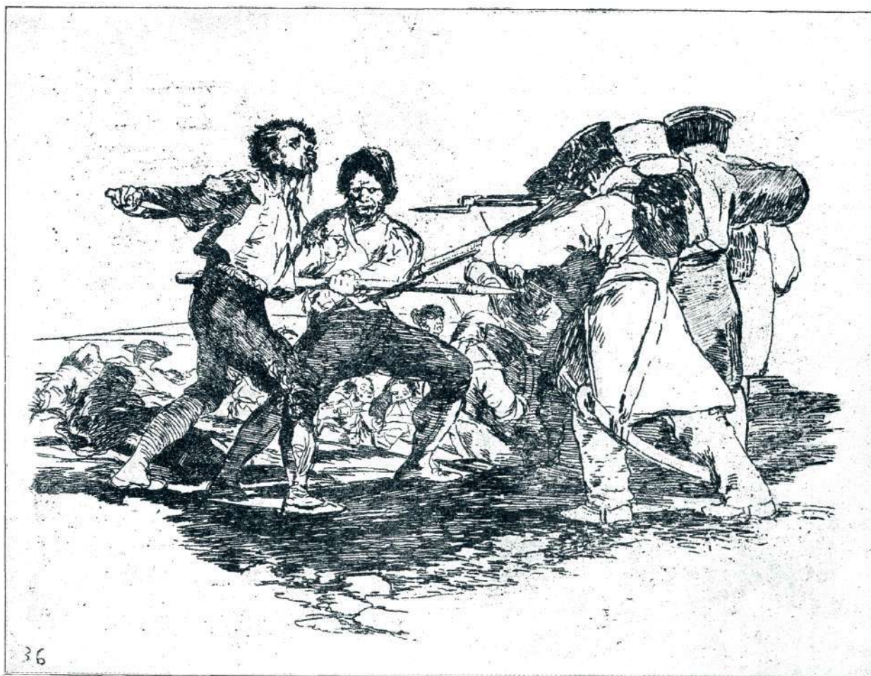
GOYA: DESASTRES DE LA GUERRA 2. Z RAZUMOM ALI BREZ NJEGA?

Molče sta vstajala in obedovala, hodila spat in vzdihovala s težkimi prsi.