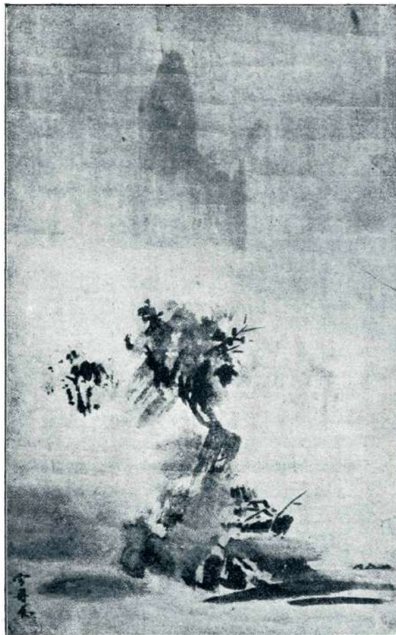
SEŠU (1420—1506), POKRAJINA.

Roka ji je padla ob telesu, dvignila je glavo. Nato je stopila skozi vrata. Pri sreču ji je bilo, kot da je pričela čisto novo življenje. Toliko doživetja v eni uri, da ni mogla vsega razvrstiti in pregledati v svoji duši!