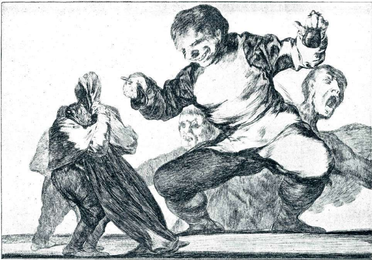
GOYA: PROVERBIOS. SPAK S KRAGULJČKI.

in se je gospa oblačila, je šel dva-, trikrat po sobi in pogledal skozi okno. Nato se je obrnil do nje.