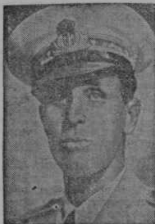
Vojvoda Aosta, poveljnik Italijanske armade v zasedeni angleški Somaliji

Ljutomer. Nastopilo je nekoliko boljše vreme, kar je tudi potrebno, če hočemo, da bo dozorela ajda in koruza. Ljudje že kopljejo krompir. Ne-