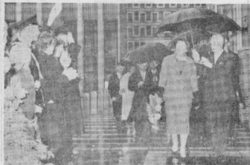
Tudi kraljici Julijani vreme ne prizanaša