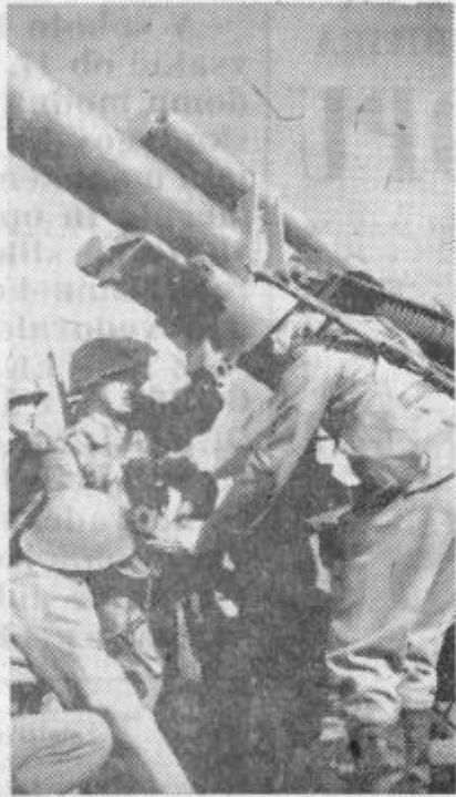
TOPNIČARJI MED SOLSKIMI VAJAMI

Današnja artilerija je močan in sodobno opremljen rod v naši vojski in ob najpopolnejših orožjih vzgaja tudi strokovno izpopolnjene ljudi, ki so sposobni rokovati z novimi orožji. Toda artilerijska vzgoja ne daje samo dobrih vojakov, temveč jih nauči tudi drugih sposobnosti: vzgaja tudi voznike, mehanike, matematike, strokovnjake za optiko in radiotehniko ipd., kar lahko ljudje koristno uporabijo tudi kasneje v vsakdanjem življenju. Tako se artilerija, podobno kakor v času NOV, tesno povezuje z življenjem in ljudmi, ki ob tej obletnici pozdravljajo naše topničarje in jim želijo še dosti uspehov.