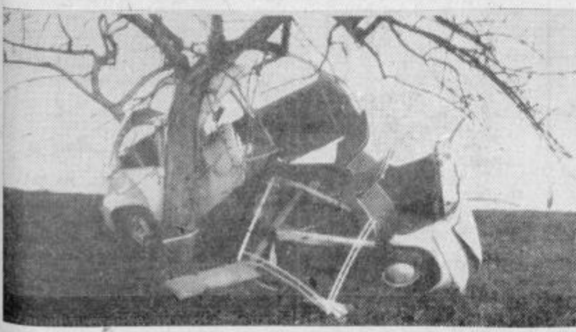
Zaradi prevelike hitrosti — ostanki »fička«