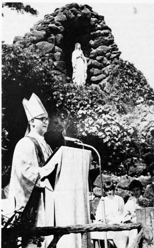
Krasen dan je bil, ko je nadškof Šuštar maševal in pridigal pri naši lurški votlini

+ Za pripravo za birmo je letos samo en kandidat. Če ne bo v kratkem več prijav, z razredom ne bomo začeli.