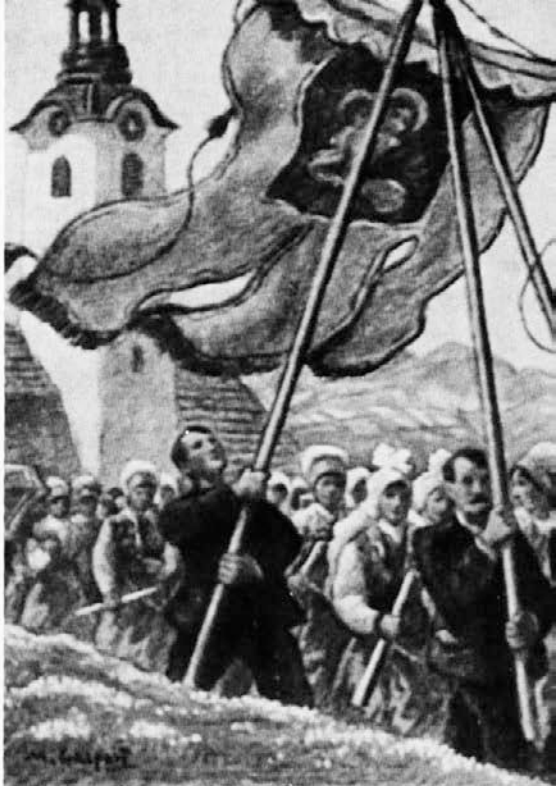
M. Gaspari: Vstajenje

Topiči so zagrmeli in grmeli vso veliko soboto. Opoldne je bil po cerkvah ali ob križih blagoslov velikonočnih košar. Košara je bila v hiši shranjena vse leto la za velikonočni žegen. Vanjo so mamice djale kuha-