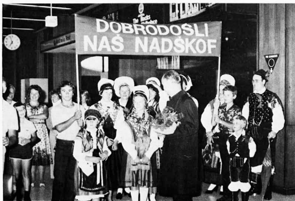
Sydneysko letališče, 29. jan. 1983: Takole je avstralska Slovenija pričakala ljubljanskega nadškofa

Kadar bodo prihajali naši rojaki domov na obisk, jih sprejmimo z odprtim srcem. Omogočimo jim, da se bodo zares počutili doma. S takšnih obiskov naj bi odnesli kar največ življenjskega prepričanja in moči, kar jih bo bogatilo še dolgo po odhodu. Vse moramo storiti, da bi njihovo življenje ostalo bogato in močno in da se ne bi nikdar spremenilo v golo životarjenje.