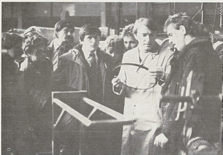
Ogled proizvodnje tovarne Sava