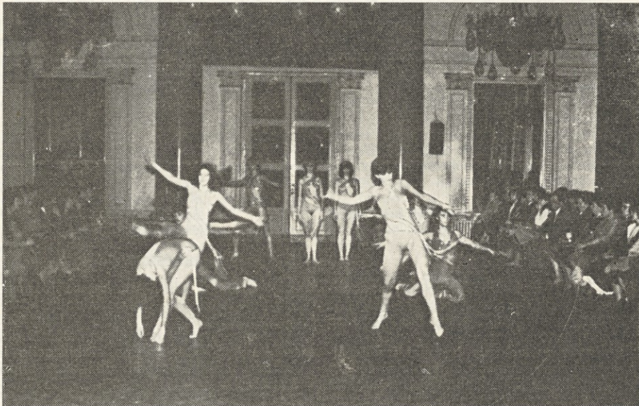
Popestritev turistične ponudbe so tudi kulturno zabavne prireditve.

Plesni klub Casina iz Ljubljane nas je razvedril s svojim plesnim »show« programom.