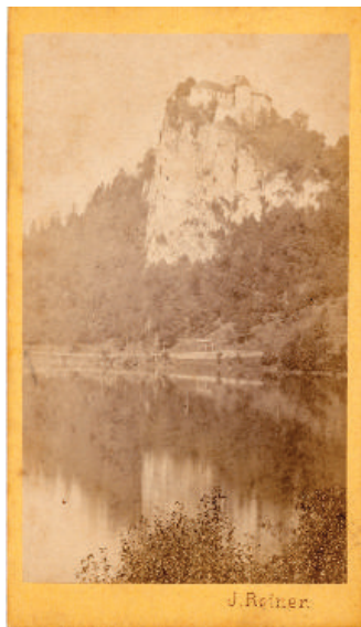
Jezero in mogočni grad nad njim na posnetku iz Kolmanove zbirke. Pred letom 1880.