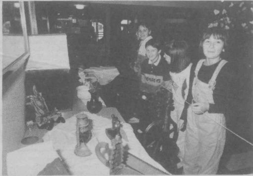
Razstava »Restavratorska dejavnost in dediščina« v OŠ Zadobrova.

»Cilja restavratorstva sta dva: Spoznavati in pa restavrirati. Če neke stvari ne poznamo, je tudi ne moremo restavrirati ali renovirati, kajti lahko se zgodi, da to naredimo narobe in s tem stvar uničimo. RC Slovenije se že povezuje s Teološko fakulteto, kajti ravno duhovniki bodo tisti, ki bodo imeli na skrbi največji del slovenske kulturne dediščine. Zavzemamo se tudi za to, da bi Univerza odprla poseben oddelek za